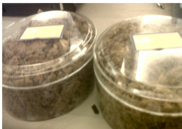
Gambar 6. Pendaftaran P-IRT ke Dinas Kesehatan Kabupaten Gresik