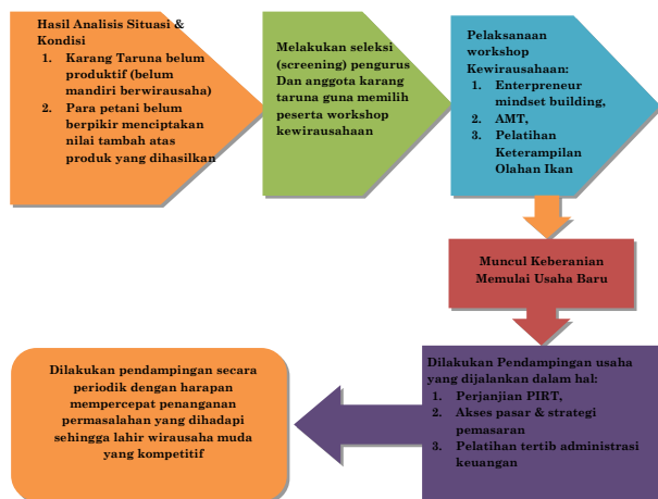
Gambar 3. Tahapan Program Pengabdian