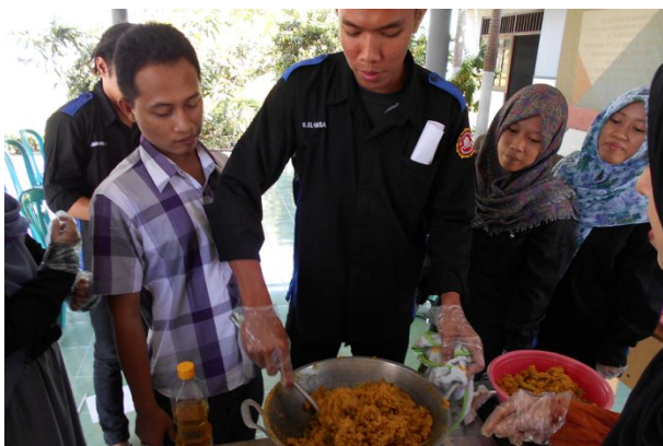
Gambar 5. Pelatihan Pembuatan Olahan (Abon) Ikan

Setelah pelatihan pembuatan abon ikan selesai dilaksanakan, pelatihan berikutnya adalah pelatihan akses pasar dan strategi pemasaran. Pelatihan ini penting dengan tujuan peserta mampu merumuskan dan memutuskan target konsumen dan jenis produk yang akan dibuat serta strategi penjualan yang dilakukan. Respon peserta sangat dinamis terlihat dalam sesi tanya jawab pelatihan ini.