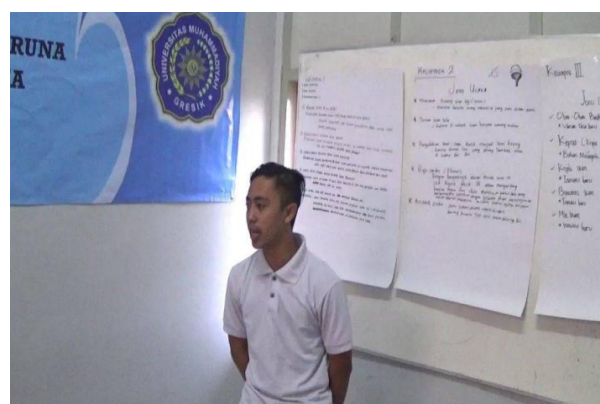
Gambar 4. Suasana Workshop

Kegiatan lanjutan yang dilaksanakan setelah workshop adalah pelatihan pembuatan olahan ikan (abon), adalah pelatihan akses pasar dan pemasaran dan pembukuan untuk UMKM. Dasar pemikir-