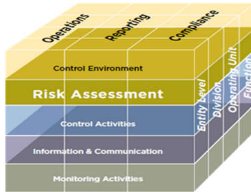
Internal Control – Integrated Framework

Menurut COSO pengendalian internal memiliki lima komponen yang harus dipenuhi, yaitu: