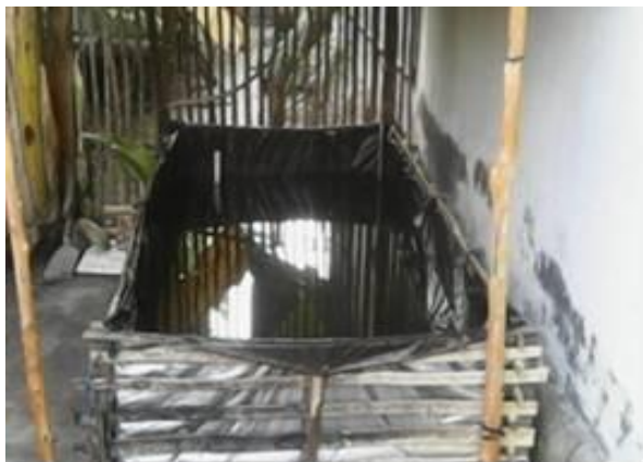
Gambar 1. Kolam Terpal Untuk Adaptasi Ikan Gambar