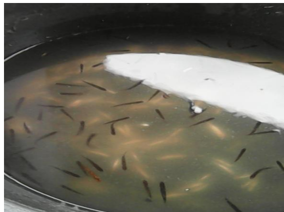
Gambar 2. Pemeliharaan Ikan Seluang di Kolam Terpal