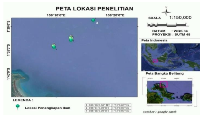
Gambar 1. Lokasi Penelitian Pengambilan Sampel Ikan

Adapun alat dan bahan yang digunakan dalam penelitian dapat dilihat pada Tabel 1.