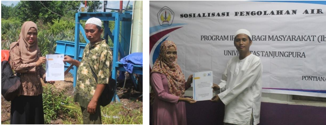
Gambar 5. Penyerahan Buku Standar Operasional dan Pemeliharaan (SOP)

Selain dilakukan sosialisasi dan pelatihan, kegiatan ini juga dilanjutkan dengan penyerahan buku Standar Operasional dan Pemeliharaan (SOP) alat pengolahan air bersih di masing – masing Pondok Pesantren.