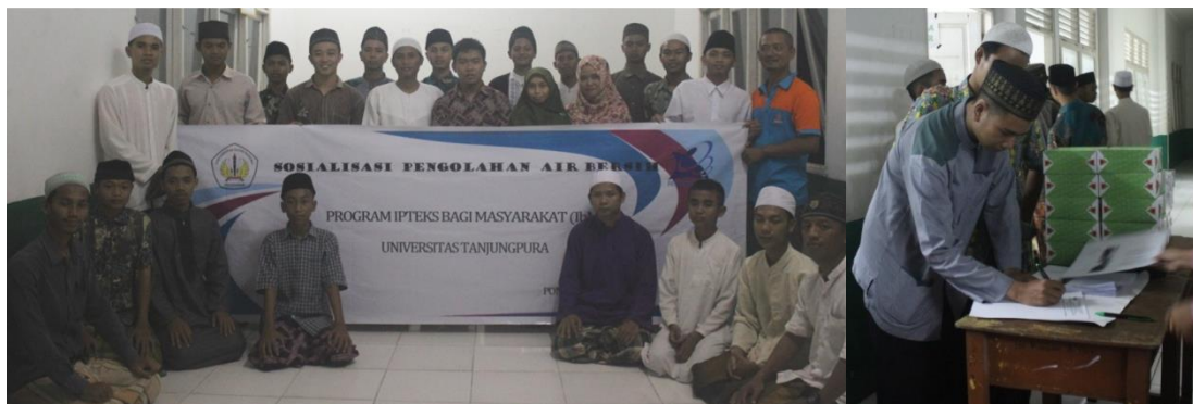
Gambar 4. Kegiatan Sosialisasi dan Pelatihan

Instalasi pengolahan air yang telah dibangun tidak diserahkan begitu saja kepada pihak Pondok Pesantren. Pada kegiatan ini juga dilakukan sosialisasi dan pelatihan agar pemakaian alat sesuai dengan prosedur dan memiliki masa pakai yang panjang. Dokumentasi kegiatan sosialisasi terlihat seperti pada Gambar 4.