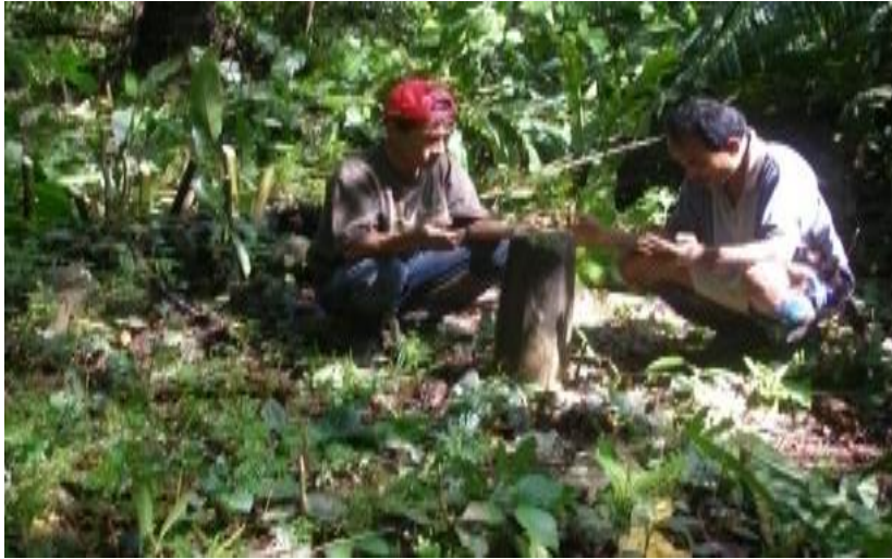
Doa di Makam panglima Dodo Baha