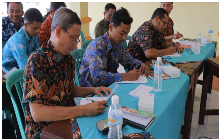
Gambar 4. Para peserta sedang mengerjakan soal latihan pada tahapan evaluasi

Tahap terakhir dalam proses pendampingan ini ialah evaluasi, di mana para peserta diminta untuk mengerjakan soal latihan mengenai penggunaan ejaan, tata bahasa, dan format surat yang sesuai dengan kaidah yang telah dibahas selama proses pendampingan. Dengan demikian, melalui tes tersebut dapat diketahui hasilnya secara langsung mengenai pemahaman para peserta pendampingan dalam memahami materi selama pendampingan. Di sisi lain, tujuan utama dari pelaksanaan pengabdian ini ialah supaya dapat diterapkan dalam menjalankan amanahnya sebagai sekretaris desa atau sekretaris kelurahan.