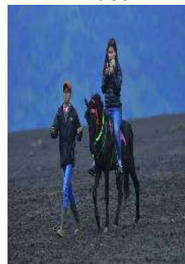
f. Hasil fokus foto