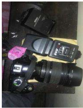
a. Perangkat kamera

Proses pengambilan gambar dan video untuk pembuatan fotografi dan videografi yang dilakukan oleh Pokdarwis (Ladesta) Desa Gubugklakah menggunakan 1 (satu) buah kamera digital untuk berbagai layanan paket wisata, sebagaimana diperlihatkan pada gambar berikut :