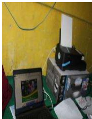
d. Proses editing