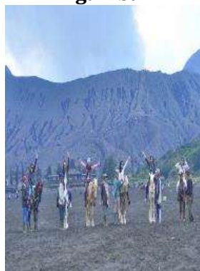
e. Hasil fotografi