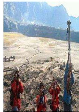
c. Pengambilan video