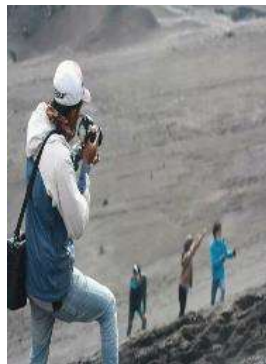
b. Pengambilan gambar