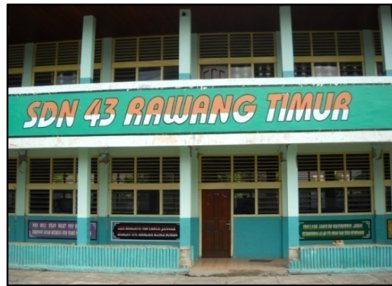
Gambar 1. SD Negeri 43 Rawang Timur

Penelitian ini bertujuan untuk mengetahui metode retrofit yang diterapkan pada perbaikan dan perkuatan komponen struktur dan non -struktur bangunan serta mengetahui besarnya efisiensi pekerjaan retrofit pada bangunan SD ini dari segi biaya dan waktu.