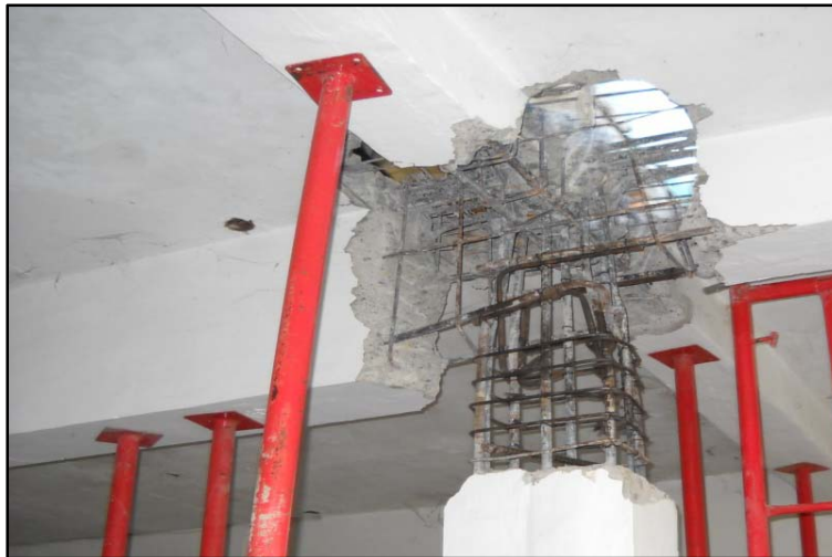
Gambar 3. Kerusakan Pada Balok