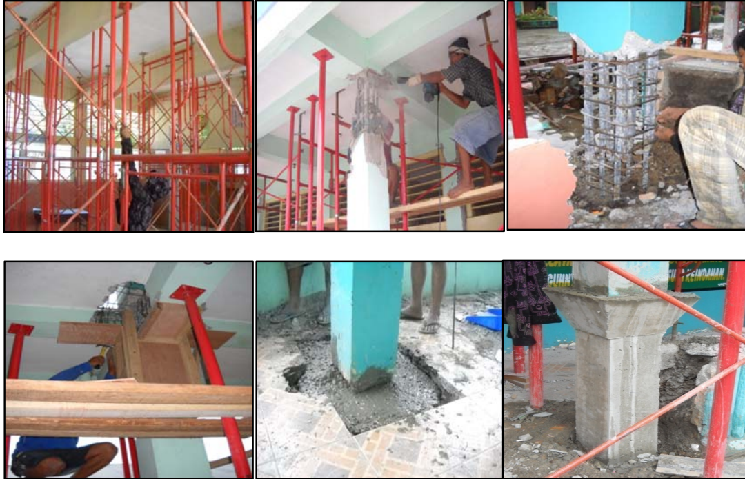
Gambar 7. Langkah-Langkah Retrofit Kolom dan Balok