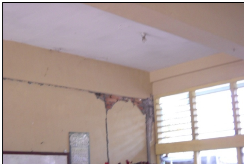
Gambar 4. Kerusakan Pada Dinding

Pada bangunan SD Negeri 43 ini kerusakan pada dinding yang terlihat hanya berupa retak-retak kecil. Pada sebagian pertemuan sudut-sudut dinding dengan kolom juga terlihat adanya kerusakan pada dinding berupa retak serta lepasnya plesteran dari dinding. Pada bagian tengah dinding kebanyakan hanya berupa retak-retak halus saja ( Gambar 4. ).