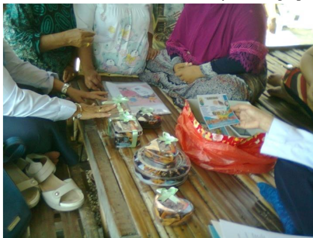
Gambar 4. Hasil olahan yang dijadikan souvenir hajat.

Temuan peneliti bahwa sebelum menggunakan peralatan mixer tersebut, maka pengolahan kerang dilakukan secara tradisional dengan mengaduk bahan menggunakan tangan sehingga hasilnya kurang optimal (kurang halus).