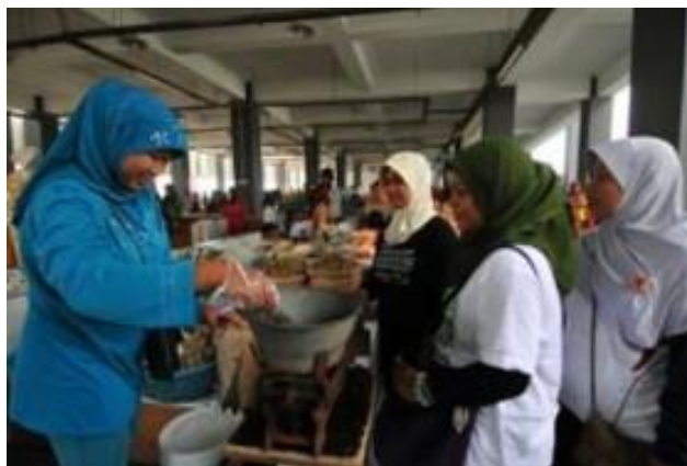
Gambar 6. Suasana Sentra Ikan Bulak .

Dengan telah diresmikannya SIB oleh Wali Kota Surabaya Tri Rismaharini suasananya semakin ramai dengan didukungnya Letak SIB yang berhadapan langsung dengan laut membuat pengunjung dapat menikmati hidangan sembari menyaksikan hamparan pemandangan laut yang indah.