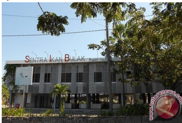
Gambar 5. Sentra Ikan Bulak

Sebagian terlihat pada gambar 5 SIB yang telah berdiri 3(tiga) tahun yang lalu masih belum efektif, pasar ini baru dikunjungi ketika ada acara seperti festival yang diselenggarakan oleh pemerintah maupun masyarakat.