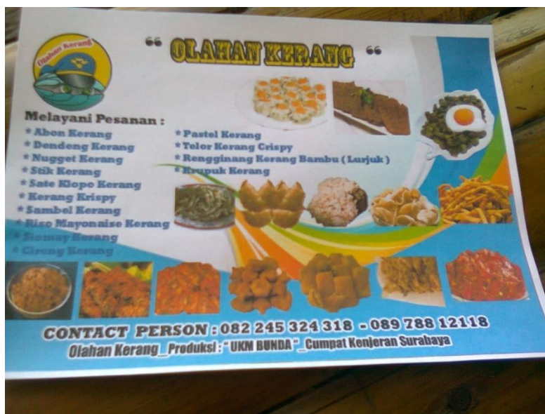
Gambar 2. Produk olahan kerang.

Dalam memproduksi produk olahan kerang tersebut menggunakan Mesin Mixer Roti untuk percepatan produksi dan mutu adonan yang lebih baik, karena selain akan menghemat waktu dalam meratakan adonan tentu saja mengaduk adonan kue dengan tangan sendiri akan sangat melelahkan dan memakan waktu yang lebih lama. Dengan adanya mesin Mixer Roti memiliki kemampuan mencampur yang lebih baik karena Mesin Mixer Roti bisa memutar pengaduk dengan tingkat putaran per menit yang tinggi. Mixer ini dilengkapi dengan pengaduk spiral untuk mengaduk adonan roti, kue, atau mi, pengaduk jenis beater untuk mengaduk adonan croissant dan pastry,