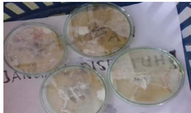
Gambar 1. Pertumbuhan koloni fungi endofit yang di isolasi dari Kulit Jeruk Nipis pada Medium PDA pada suhu 25^{\circ}\text{C} .

Kulit buah jeruk nipis yang ditumbuhkan kedalam media PDA, diperoleh 2 isolat fungi endofit. Untuk mengetahui hasil isolat fungi endofit yang berhasil ditumbuhkan pada media PDA dapat dilihat pada gambar 1.