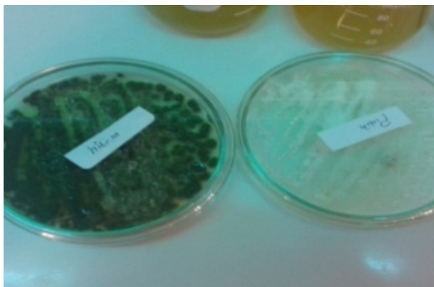
Gambar 2. koloni fungi endofit berdasarkan morfologi bentuk dan warna.