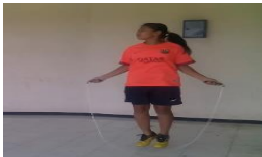
Gambar 1 Meloncat Dengan Dua Kaki

“ Skipping merupakan gerakan plyo-metric yang digunakan untuk menggerakkan otot tungkai dan otot-otot khusus (Pertama, 2013:6)”. Aprianto (2014:24) mendefinisikan sebagai berikut. Latihan skipping dilakukan dengan cara meloncat satu kaki bergantian kanan dan kiri, masing-masing kaki 10 repetisi dan meningkat 4 repetisi setiap 3 kali pertemuan, setiap pertemuan 4 set, dilakukan dengan irama secepat mungkin (eksplosif), recovery 30 detik antar set, pemberian perlakuan dilakukan 3 kali seminggu dengan lama pemberian 16 kali tatap muka. Berikut ini adalah Gambar 1 tentang meloncat dengan dua kaki.