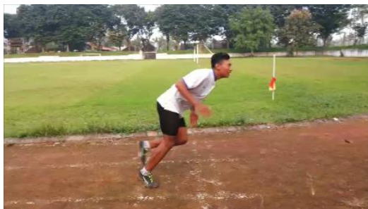
Gambar 5 Sikap Finish

Sikap finish adalah gerakan tambahan sebelum berhenti secara mendadak. Di-lakukan sedemikian dengan badan condong ke depan untuk mendapatkan waktu yang baik dan kepala ditundukkan dengan mempertahankan posisi saat lari, kaki tetap dalam kecepatan, tangan tetap mengayun dengan begitu koordinasi, kekuatan, kemampuan pencapaian energi maksimal dan mempunyai hasil yang maksimal pula. Hal ini bertujuan agar tubuh dapat beradaptasi kembali dari gerakan lari sampai berhenti total untuk mencegah terjadinya cedera. Gambar 5 sikap finish dapat dilihat di halaman berikut.