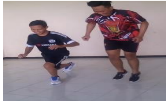
Gambar 2 Gerakan Split Jump

Latihan split jump merupakan latihan dasar untuk mengembangkan power otot-otot flexor , extensor , quadriceps , gluteals , hamstrings . Latihan plyometric digunakan untuk meningkatkan elastisitas dan kekuatan otot. “latihan split jump sangat dianjurkan untuk diterapkan dalam latihan karena terbukti memberikan impact (pengaruh positif), di mana pengaruhnya berupa penambahan kecepatan (Azizi, 2013:11)”. Adapun Gambar 2 tentang gerakan split jump dapat dilihat di bawah ini.