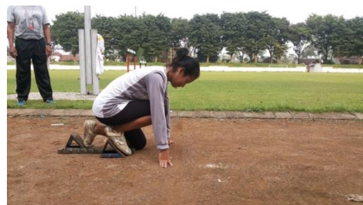
Gambar 4 Sikap Bersedia

Untuk mendapatkan hasil kecepatan yang maksimal saat lari maka yang di-lakukan seperti berikut. Start Jongkok “ Start termasuk kondisi siap ketika sudut depan adalah 90 derajat dan sudut lutut belakang adalah 120 derajat (Indra dan Lumintuarso, 2014:158)”. Konsentrasi saat panitia memberi aba-aba “bersedia”, maka pandangan melihat garis start . Saat panitia memberikan aba-aba “ya” pandangan mengikuti pergerakan tubuh saat lari. Pada tungkai kaki, terjadi gerakan fleksi saat berada pada tumpuan start block , dan bertemunya permukaan rectus abdominis dengan permukaan rectus femoris . Adapun sikap bersedia dapat dilihat pada Gambar 4 di bawah ini.