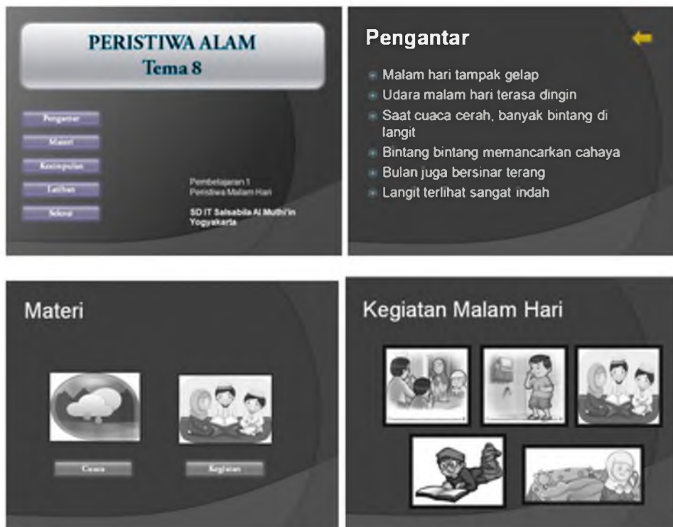
Gambar 3. Contoh bahan ajar tematik berbasis multimedia