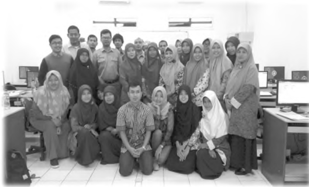
Gambar 1. Guru-guru SD IT Salsabila Al-Muthi'in peserta pendampingan beserta Dosen-dosen pendamping hari ke-2.

2. Meningkatnya kompetensi bagi guru dalam pembuatan bahan ajar berbasis multimedia. Contoh bahan ajar berbasis multimedia yang dibuat oleh guru setelah pengabdian kepada masyarakat.