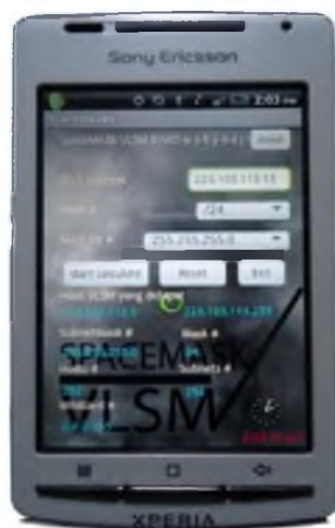
Gambar 3 Tampilan Antarmuka Spacemask Layout.