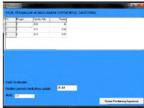
Gambar 2 Tampilan Menu Perhitungan Exponential Smoothing

Implementasi menu sistem pendukung keputusan, Pada halaman ini terdapat hasil perhitungan peramalan jumlah penumpang dari Least Square dan Exponential Smoothing . Jika jumlah penumpang melebihi kapasitas halte maka pada halaman ini akan menampilkan jumlah kekurangan dan harus diperluas berapa meter. Perhitungan dengan metode Exponential Smoothing menggunakan \alpha 0,1 dan akan menunjukkan hasil nilai eror dari masing-masing perhitungan. Hasil nilai eror yang lebih kecil akan dipakai untuk pengambilan keputusan. Tampilan Menu Sistem Pendukung Keputusan dapat dilihat pada Gambar 3.