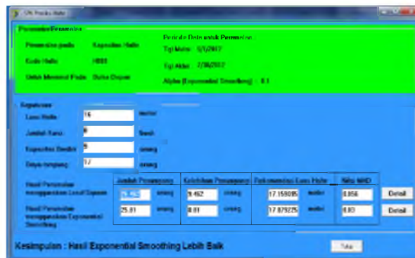
Gambar 3 Tampilan Menu Sistem Pendukung Keputusan

Implementasi menu sistem pendukung keputusan, Pada halaman ini terdapat hasil perhitungan peramalan jumlah penumpang dari Least Square dan Exponential Smoothing . Jika jumlah penumpang melebihi kapasitas halte maka pada halaman ini akan menampilkan jumlah kekurangan dan harus diperluas berapa meter. Perhitungan dengan metode Exponential Smoothing menggunakan \alpha 0,1 dan akan menunjukkan hasil nilai eror dari masing-masing perhitungan. Hasil nilai eror yang lebih kecil akan dipakai untuk pengambilan keputusan. Tampilan Menu Sistem Pendukung Keputusan dapat dilihat pada Gambar 3.