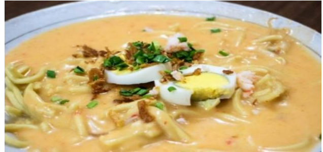
Gambar 6. Foto makanan Mie Celor

Mie Celor disajikan dengan kuah kental, ditambah dengan daging, udang, kecambah, daun bawang, dan bawang goreng. Biasanya ditambah dengan potongan telur ayam rebus. Rasanya khas sekali.