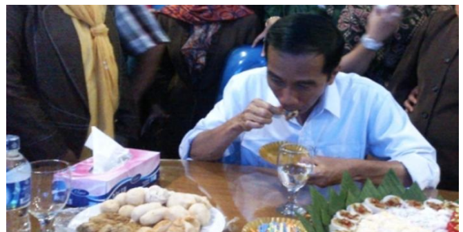
Gambar 17. Foto Presiden RI Joko Widodo sedang menikmati makanan empek-empek Palembang

Sepanjang pelaksanaan pertunjukkan seni dan budaya di Pedestrian Jalan Jendral Sudirman masyarakat dapat menjajakan kuliner atau masakan khas Sumatera Selatan di sepanjang Pedestrian sehingga pengunjung lebih mengenal beranekaragam kuliner sesuai dengan kearifan lokal khas yang ada di Sumatera Selatan. hal ini akan menimbulkan kesan tersendiri bagi masyarakat dan wisatawan yang belum pernah mencicipi makanan selian pempek te ntunya.