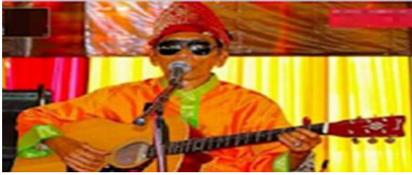
Gambar 14. Penampilan seniman Palembang

Pemanfaatan pedestrian Jendral Sudirman bisa mengangkat potensi lagu-lagu daerah Sumatera Selatan khususnya Tembang Batang Hari 9 yang sudah banyak ditinggalkan sehingga sulit untuk menemukan seniman yang bisa membawakan lagu khas Sumatera Selatan yang sangat fenomenal ini. Penggunaan bahasa daerah di Sumatera Selatan seringkali menimbulkan kebingungan bagi sebagian besar masyarakat asli Palembang yang tidak memahami bahasa diluar Palembang.