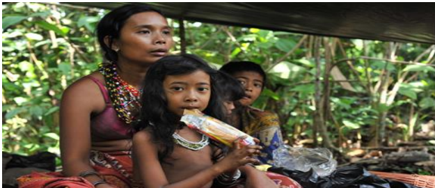
Gambar 3. Foto suku kubu yang tinggal di pedalaman

Suku Kubu merupakan suku asli pedalaman yang menempati wilayah Sumatera Selatan dan Jambi selain itu terdapat 12 Suku Besar yang ada di Sumatera Selatan.