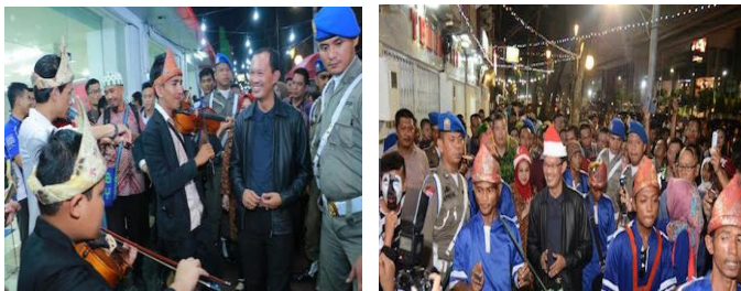
Gambar 12. Foto rombongan Wali Kota Palembang berkunjung di Pedestrian

Pakaian adat di Sumatera Selatan beranekaragam sesuai dengan daerah kabupaten yang terdapat di Sumatera Selatan. Pakaian adat tersebut mencerminkan kearifan lokal dari dari masing-masing sesuai dengan lingkungan tempat masyarakat tersebut tinggal dan menetap.