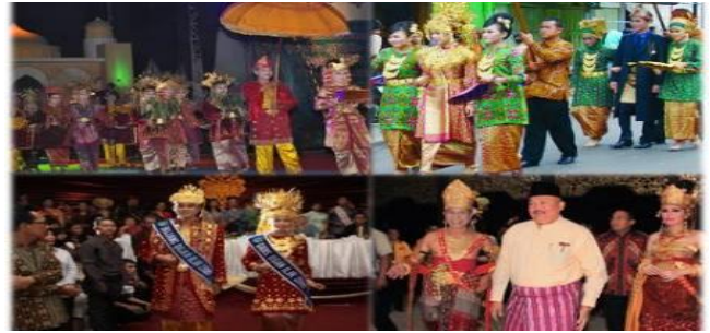
Gambar 16. Gubernur Sumatera Selatan di Pedestrian

ataupun antara bahasa antara dusun yang satu dengan dusun yang lain dalam satu kabupaten.