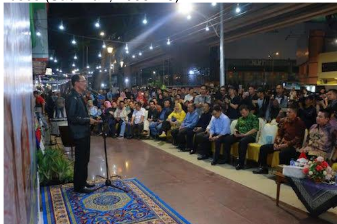
Gambar 10. Foto kegiatan dan keramaian di Pedestrian Soederman Palembang

Dengan memanfaatkan Pedestrian Jalan Jendral Sudirman seluruh masyarakat dapat menampilkan kearifan lokal berupa rumah adat sesuai asal daerah mereka masing-masing seperti rumah adat dari Oki dan Oku atau kabupaten kota lainnya dalam bentuk maket. maket sebuah bangunan adalah model dari bangunan yang sebenarnya tetapi bukan simulasi karena tidak untuk menggambarkan proses (Sadiman, 2008: 76).