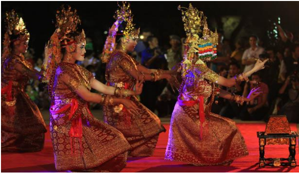
Gambar 11. Foto pertunjukan tarian tradisional di pedestrian Palembang

Masyarakat lebih banyak menampilkan tari kreasi melayu dan tari kreasi lainnya. Oleh sebab itu, masyarakat yang ingin menampilkan tarian hendaknya dapat menampilkan tari khas daerah yang ada di Sumatera selatan seperti tari khas dari daerah Lahat, Pagaralam, Prabumulih dan kabupaten lainnya agar lebih menarik minat wisatawan lokal maupun wisatawan domestik.