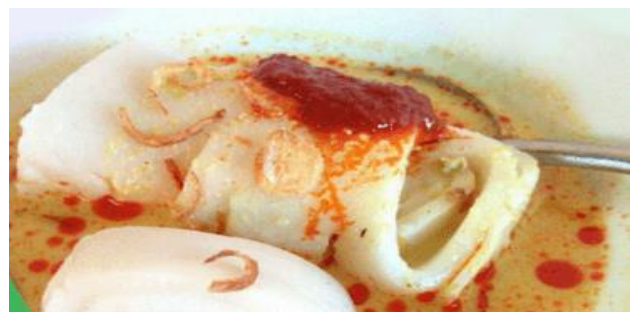
Gambar 8. Foto Burgo

Burgo terbuat dari tepung beras. Sebenarnya jika irisannya lebih kecil, burgo menjelma menjadi kwetiau. Hanya saja burgo ini dinikmati bersama dengan kuah santan pedas. Sangat cocok jika dinikmati dengan Laksan dan ditambah telur ayam rebus.