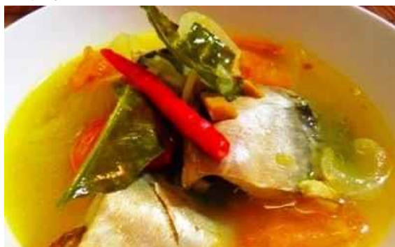
Gambar 5. Makanan Pindang

Pindang adalah makanan khas Palembang selain pempek yang sangat terkenal. Di Palembang sendiri, ada pindang ikan patin dan pindang tulang. Rasanya yang sangat khas membuat kita ketagihan menyantapnya.