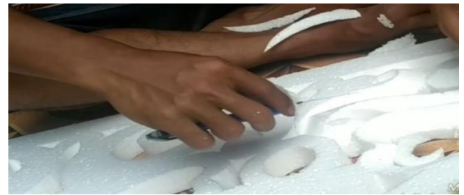
Gambar 13 Foto kegiatan kerajinan masyarakat Palembang

Dengan membuat kerajinan dari bahan yang berbahaya akan memotivasi masyarakat khususnya anak-anak untuk lebih mengenal lebih dalam budaya daerah Sumatera Selatan. Di sepanjang Pedestrian Jendral Sudirman peneliti sering mendengar berbagai macam lagu yang dinyanyikan oleh para masyarakat atau komunitas yang menampilkan karyanya di sepanjang Pedestrian. Namun kebanyakan dari lagu yang didengar merupakan lagu dangdut dan lagu barat. Menurut Hamdju (1980) lagu adalah cetusan ekspresi dasar dari hati manusia yang dikemukakan secara teratur dalam bentuk bahasa bunyi. Sumatera Selatan memiliki lagu daerah yang sangat mencerminkan kearifan lokal Sumatera Selatan yaitu Tembang Batang Hari 9 yang menceritakan 9 anak sungai yang ada di Sumatera Selatan. Masyarakat atau komunitas musik Palembang hendaknya melestarikan musik khas Sumsel ini dengan menyajikan tampilan lagu-lagu daerah di sepanjang Pedestrian Jendral Sudirman.