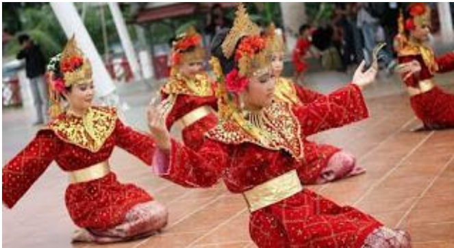
Gambar 2. Foto Tari Tradisional tari Tangga Sumatera Selatan

Tari Tanggai merupakan tarian tradisional dari Sumatera Selatan yang juga dipersembahkan untuk menyambut tamu kehormatan. Berbeda dengan tari Gending Sriwijaya, Tari Tanggai dibawakan oleh lima orang dengan memakai pakaian khas daerah seperti kain songket, dodot, pending, kalung, sanggul malang, kembang urat atau rampai, tajuk cempako, kembang goyang, dan tanggai yang berbentuk kuku terbuat dari lempengan tembaga.