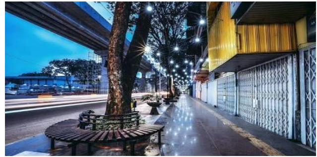
Gambar 9. Foto lokasi pedestrian Jalan Soederman

Wali Kota Palembang Harnojoyo menjelaskan, di perbaikinya trotoar ini diharapkan dapat mengembalikan fungsi pedestrian di kawasan jalan protokol. Dengan begitu, tidak hanya menjadi nyaman bagi pejalan kaki, tetapi juga bisa menjadi destinasi pariwisata. Untuk memberikan kenyamanan bagi pejalan kaki, pedestrian diperlebar dari tiga meter menjadi enam meter (Kompas.id, 2017).