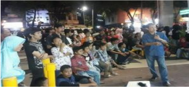
Gambar 15. Kegiatan masyarakat Palembang di Pedestrian

Pemanfaatan pedestrian Jendral Sudirman bisa mengangkat potensi lagu-lagu daerah Sumatera Selatan khususnya Tembang Batang Hari 9 yang sudah banyak ditinggalkan sehingga sulit untuk menemukan seniman yang bisa membawakan lagu khas Sumatera Selatan yang sangat fenomenal ini. Penggunaan bahasa daerah di Sumatera Selatan seringkali menimbulkan kebingungan bagi sebagian besar masyarakat asli Palembang yang tidak memahami bahasa diluar Palembang.