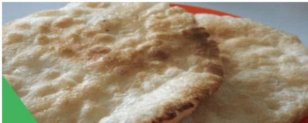
Gambar 4. Foto makanan Kemplang ciri khas Sumatera Selatan

Kemplang sendiri ada 2 jenis, yaitu kemplang ikan dan kemplang sagu. Kemplang ikan biasanya bertekstur lebih padat dibandingkan dengan kemplang sagu. Banyak orang yang salah mengartikan kemplang dan kerupuk. Perbedaan kemplang dan kerupuk yaitu pada proses pembuatannya. Kerupuk melalui proses penggorengan. Sedangkan kemplang dibakar. Biasanya kemplang dinikmati dengan saos cabe merah.