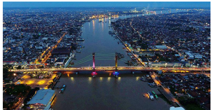
Gambar 18. Foto Ampera tampak dari atas Kota Palembang