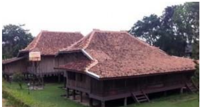
Gambar 1. Foto Rumah Limas Palembang sebagai rumah tradisional masyarakat Palembang Sumatera Selatan

Di Sumatera Selatan, seperti halnya dengan daerah lain di Indonesia, terdapat karya seni arsitektur yaitu Rumah Limas dan masih bisa kita temukan sebagai rumah hunian di daerah Palembang. Rumah Limas Palembang telah diakui sebagai Rumah Adat Tradisional Sumatera Selatan. Secara umum arsitektur Rumah Limas Palembang, pada atapnya berbentuk menyerupai piramida terpenggal (limasan). Keunikan rumah Limas lainnya yaitu dari bentuknya yang bertingkat-tingkat (kijing). Dindingnya berupa kayu merawan yang berbentuk papan. Rumah Limas Palembang dibangun di atas tiang-tiang atau cagak.