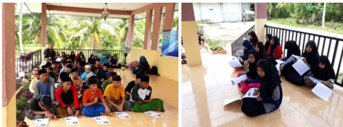
Gambar 2. Sosialisasi dan Pelatihan Pengolahan Air Bersih

Sosialisasi dan pelatihan di Pondok Pesantren An-Nur dilaksanakan pada hari Minggu, 3 Juni 2018. Sedangkan kegiatan Sosialisasi dan pelatihan di Pondok Pesantren Darussalam dilakukan pada Hari Sabtu, 9 Juni 2018. Kegiatan ini diikuti oleh pimpinan pesantren, ustadz, santriwan, dan santriwati