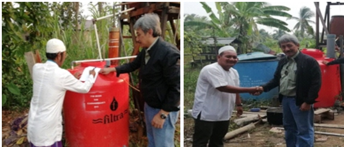
Gambar 4. Serah Terima Instalasi Pengolahan Air Bersih

Kegiatan terakhir adalah serah terima instalasi pengolahan air bersih (Gambar 4) serta Modul dan Standar Operasional Pelaksanaan (SOP) pengolahan air bersih sebanyak 2 buah di setiap lokasi mitra. Modul dan Standar Operasional Pelaksanaan (SOP) pengolahan air bersih menjadi panduan dalam kegiatan operasional dan pemeliharaan alat, membantu dalam mengatasi permasalahan yang terjadi pada alat pengolahan air, serta memudahkan mitra dalam mengelola dan memelihara instalasi pengolahan air bersih.