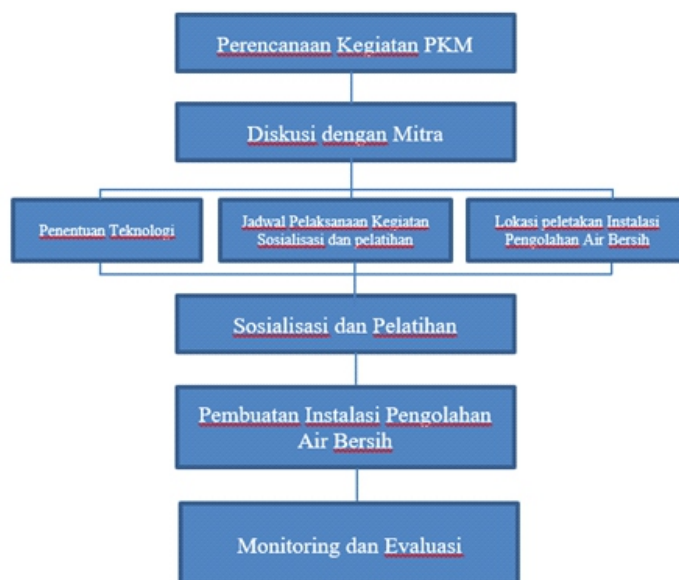
Gambar 1. Alur Pelaksanaan Kegiatan PKM

Adapun alur pelaksanaan kegiatan PKM Pengolahan Air Bersih dapat dilihat pada gambar 1 berikut.