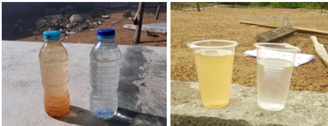
Gambar 5. Perbandingan Air Sumur dan Air Hasil Pengolahan Air Bersih