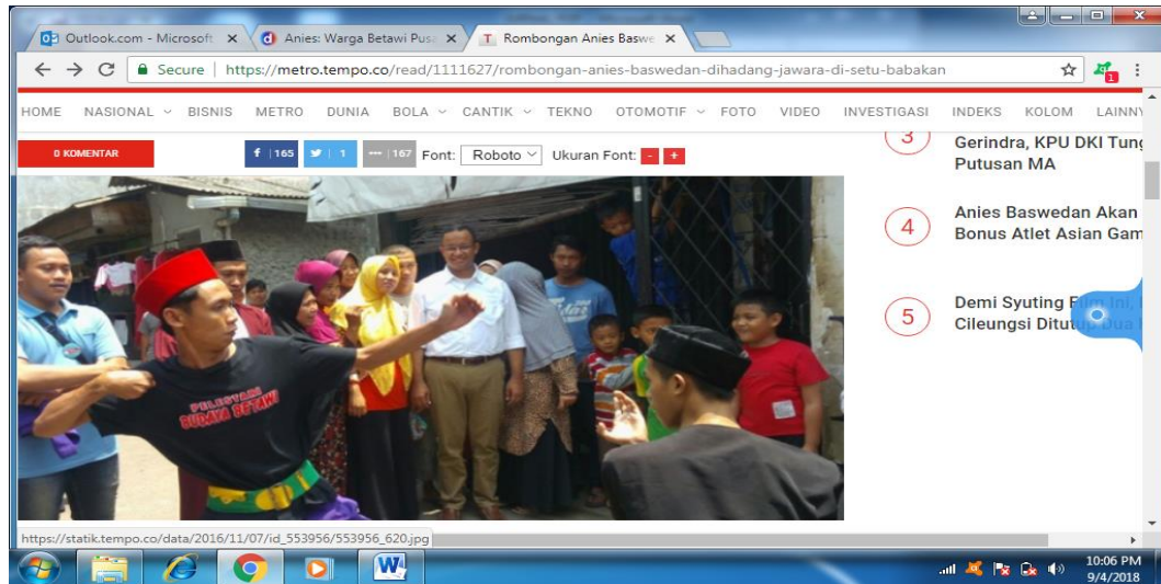
Gambar 3. Kunjungan Kampung Budaya Anis-Sandi

Gambar tersebut merupakan foto salah satu sudut yang ada di perkampungan kebudayaan Betawi Setu Babakan kelurahan Jagakarsa Jakarta Selatan.