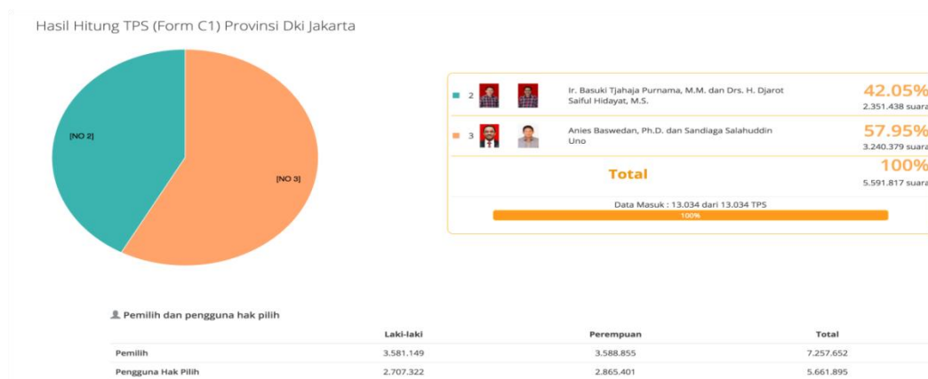
Gambar 1. Hasil Perolehan Suara Pilgub DKI 2017

Dari hasil perolehan suara diatas menunjukkan bahwa pasangan Anies-Sandi lah yang memenangkan ajang pemilihan Gubernur DKI Jakarta 2017. Dalam laporan yang dilangsir oleh KPU, Ketua Komite Independen Pemantau Pemilu (KIPP) mengatakan bahwa peran organisasi kemasyarakatan (Ormas) yang ada di Jakarta sangat terasa, peran ormas semakin meningkat dan signifikan dalam mengawal Pilgub DKI Jakarta 2017 silam