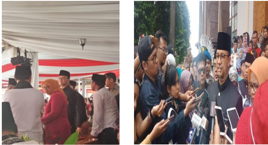
Gambar 5. Rombongan Anis-Andi Saat Kampanye

Gambar diatas adalah foto Bapak Gubernur Anies Baswedan beserta istri dan rombongannya yang turut hadir pada acara ulang tahun Betawi yang diadakan pada hari Jumat –Minggu tanggal 27-29 Juli 2018. Acara yang diadakan di perkampungan Betawi Setu Babakan kelurahan Jagakarsa Jakarta Selatan tersebut, dihadiri oleh berbagai tokoh dan organisasi masyarakat Betawi. Acara tersebut diadakan setiap tahun untuk memperingati ulang tahun Betawi.