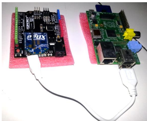
Gambar 3 Pemasangan arduino pada raspberry

Pada tahapan ini raspberry akan dihubungkan dengan arduino, untuk menghubungkannya yaitu dengan menggunakan kabel data USB to Data. Socket USB pada raspberry dihubungkan dengan socket data pada arduino. Pemasangan perangkat arduino pada raspberry dapat dilihat pada Gambar 3.