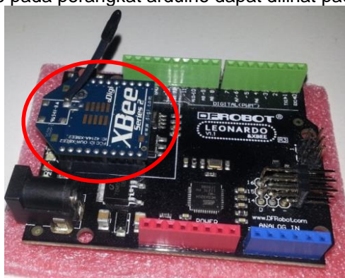
Gambar 1 Pemasangan modul xbee pada perangkat arduino

Pada tahapan ini dilakukan pemasangan modul xbee pada perangkat arduino dengan menempatkan modul xbee pada socket xbee yang tersedia pada perangkat arduino. Pemasangan modul xbee pada perangkat arduino dapat dilihat pada Gambar 1.