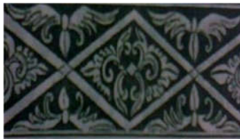
Gambar 2. Motif Saik Galamai

Ajik atau galamai adalah makanan khas Minangkabau yang dalam penyajiannya dipotong-potong dengan teliti sehingga berbentuk jajaran genjang. Makna motif ini adalah kehati-hatian dalam berbuat dan menghadapi berbagai permasalahan supaya tidak bertambah rumit (Zulhelman, 2001:106). Bentuk jajaran genjang pada motif saik galamai ini lah yang dimanfaatkan sebagai hiasan maupun dijadikan bentuk model baju dalam penciptaan kriya ini.