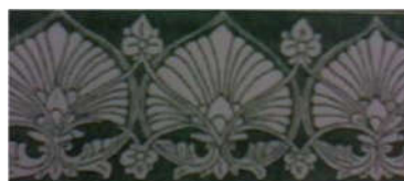
Gambar 1. Motif Siriah gadang

Motif siriah gadang (sirih besar) di bawah ini adalah motif hias Minangkabau yang dijadikan objek garapan busana dalam karya. Pemilihan motif Siriah gadang dan Saik galamai pada karya ini untuk menyesuaikan antara motif dengan konsep baju yang bertujuan untuk busana pesta.