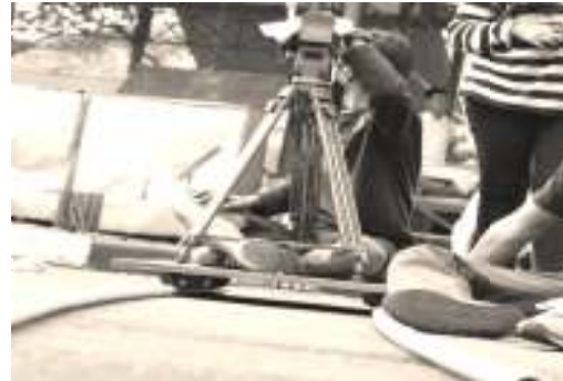
Gambar 3. Dolly track sebagai kelengkapan shooting