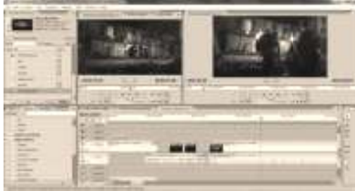
Gambar 9. Proses editing dengan software Adobe Premiere CS3