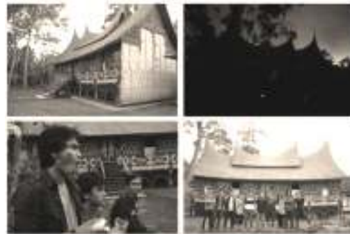
Gambar 7. Proses shooting hari terakhir di nagari Lubuak Bauak Sumber: Dok. Izan Qomarats, 2013.

Proses Pasca Produksi. Setelah proses shooting selesai, maka tahap berikutnya adalah tahap editing dari gambar-gambar yang sudah diproduksi sebelumnya.