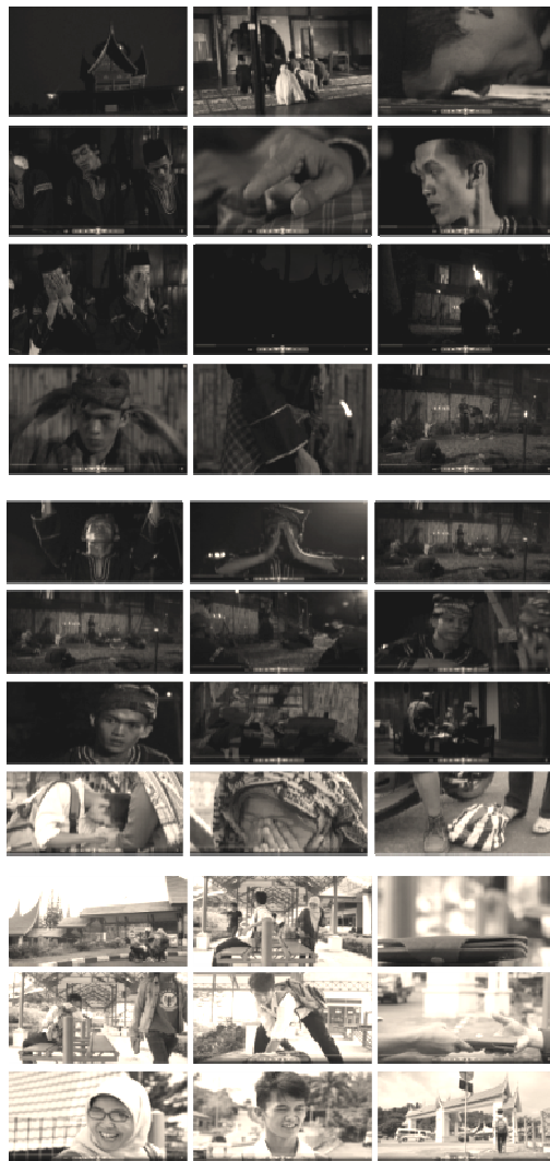
Gambar 10. Screen shot TVC Pesona Ranah Minang