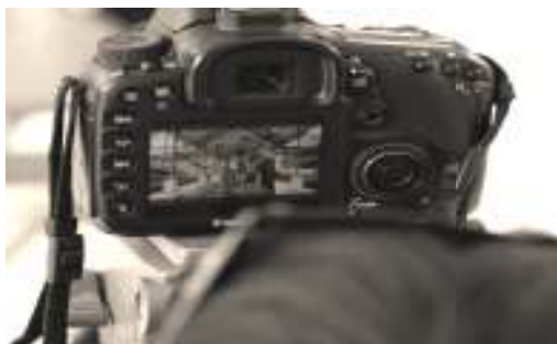
Gambar 2. Kamera SLR Canon EOS 7D Sumber: Dok. Izan Qomarats, 2013.