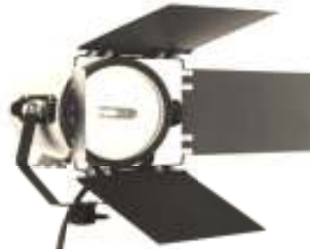
Gambar 4. Blonde lighting sebagai perlengkapan shooting

Proses produksi dilaksanakan di tiga lokasi, yaitu di nagari Sumpu Kabupaten Tanah Datar, surau nagari Lubuak Bauak, dan kota Padangpanjang.