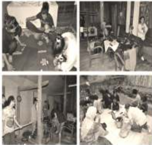
Gambar 5. Persiapan set dan property oleh tim artistik