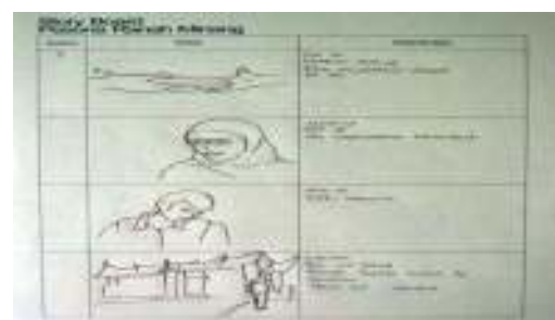
Gambar 1. Storyboard video destination branding Pesona Ranah Minang