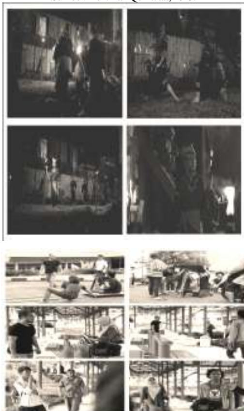
Gambar 6. Proses shooting di nagari Sumpu dan Padangpanjang