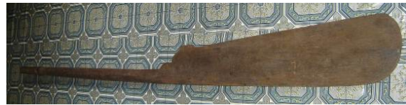
Gambar 5. Dayung yang terpotong bagian tangkainya.