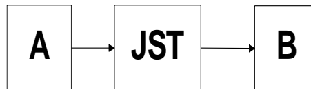
Gambar 1 Blok Diagram