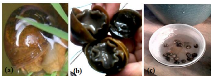
Gambar 1. (a) Gambar keong emas yang masih sehat, (b) keong emas yang sudah mati dengan operculum terbuka, (c) keong emas yang sudah mati mengapung di atas air.

Aplikasi ekstrak biji jarak pagar menyebabkan keong emas uji menunjukkan gejala keracunan dan kematian. Keong emas yang keracunan menunjukkan gejala seperti tidak aktif makan, mengeluarkan lendir berwarna putih dan gerakan yang lamban. Sedangkan kematian keong emas ditandai dengan bau yang tidak sedap, tubuh keluar dari cangkang dan terjadi perubahan warna pada keong emas yaitu dari warna kuning terang menjadi kuning pucat kehitaman (Gambar 1).