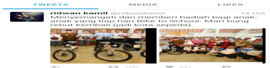
Gambar 4.1 Menyemangati dan pemberian hadiah oleh Ridwan Kamil

Tidak hanya menjawab dalam twitter, tetapi Ridwan Kamil sendiri menanggapi informasi tersebut dengan datang ke lokasi. Hadirnya bapak Ridwan Kamil selaku Walikota Bandung menunjukkan respon cepatnya sebagai pemimpin daerah untuk membantu menangani permasalahan kota Bandung, dalam kesempatan lain dia juga terlibat langsung dalam upaya ada kegiatan apapun yang ada di Kota Bandung. Seperti contoh dibawah ini salah satu program kerja walikota bandung di hari senin dan kamis bus gratis but sekolah, ini merupakan salah satu program kerja walikota bandung yang mana pesan ini merupakan fakta, pesan yang disampaikan beliau didalam akun twitternya.