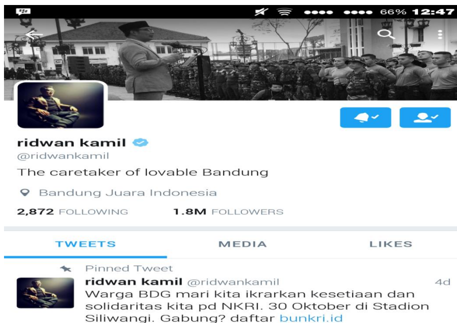
Gambar 2 Tampilan Twitter @Ridwan Kamil

Seperti diketahui, Ridwan kamil merupakan seorang pejabat publik yang intens menggunakan twitter sebagai media komunikasi dua arah dengan warga kota Bandung. Hal ini terlihat dari kicauannya di twitternya yang kebanyakan berisi pesan informatif, persuasif dibandingkan hanya sekedar update soal pribadi. @ridwankamil nama akun twitternya, pertama kali bergabung pada bulan Oktober 2009 hingga sekarang. Sampai pada Bulan Oktober 2016 akun @ridwankamil telah memiliki pengikut (follower) sebanyak 1,8jt.