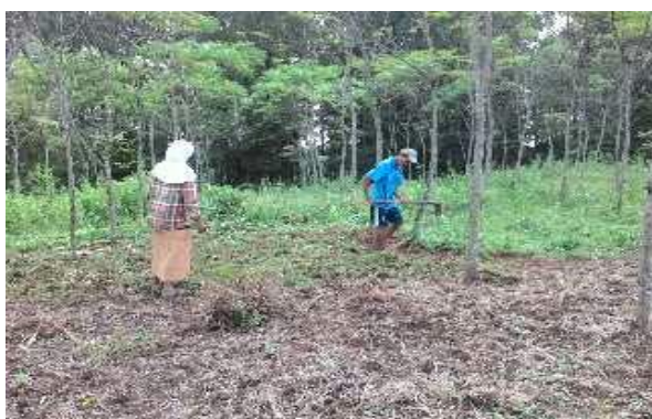
Gambar (Figure) 3. Petani penggarap di Hutan Penelitian Parungpanjang (Local farmers in forest research Parungpanjang)

Ini sejalan dengan norma yang berlaku di masyarakat, norma sosial bersifat mengikat ke dalam, sehingga jika terdapat penyimpangan norma dalam masyarakat maka sanksinya akan disalahkan oleh masyarakat umum. Sistem seperti ini adalah bentuk kontrol sosial yang efektif. Ia tidak tertulis, namun menjadi panduan untuk menentukan apa pola perilaku yang diharapkan dari orang-orang dalam suatu masyarakat, yaitu perilaku-perilaku yang dinilai baik di masyarakat (Syahyuti, 2008).