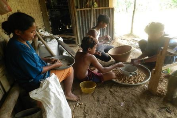
Gambar (Figure) 3. Kondisi sosial ekonomi petani penggarap Hutan Penelitian Parungpanjang (Socioeconomic condition of farmer in HP Parungpanjang)

ke sekolahkan perlu jajan, ngasih dua ribu rupiah setiap hari untuk jajanpun saya nggak sanggup” (Petani penggarap, 55 tahun, 4 anak, Babakan, Tapos, 2017).