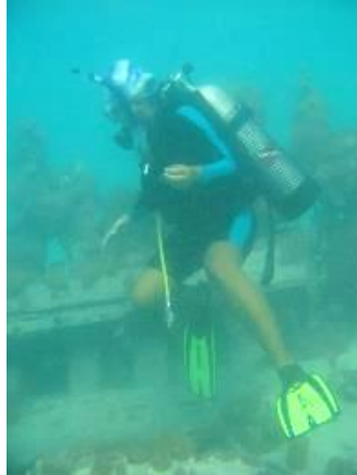
Gambar 3. Penyelaman di sisa-sisa kayu kapal Situs Seruni

Situs Seruni merupakan situs bangkai kapal kayu yang berada di sebelah tenggara Pulau Seruni. Selain karena kedalaman situs ini yang hanya sekitar 8-13 m, posisinya yang terlindung oleh gosong Pulau Seruni di sebelah selatannya juga membuat kondisi perairan di sekitar bangkai kapal sangat tenang, terlindung oleh pengaruh arus dari laut lepas dari sebelah selatan, sehingga aman untuk kegiatan penyelaman. Untuk mencapai situs ini, diperlukan waktu sekitar 2 jam dari Dermaga Syahbandar dengan menggunakan perahu nelayan/ speedboat . Menurut informasi dari masyarakat lokal, bangkai kapal tersebut karam sekitar 18 tahun yang lalu. Kondisi bangkai kapal yang masih dapat diamati saat ini adalah beberapa gading dan bagian haluan kapal.