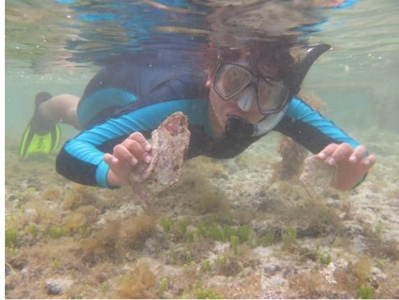
Gambar 4. Keramik kuno yang ditemukan di Situs Genting