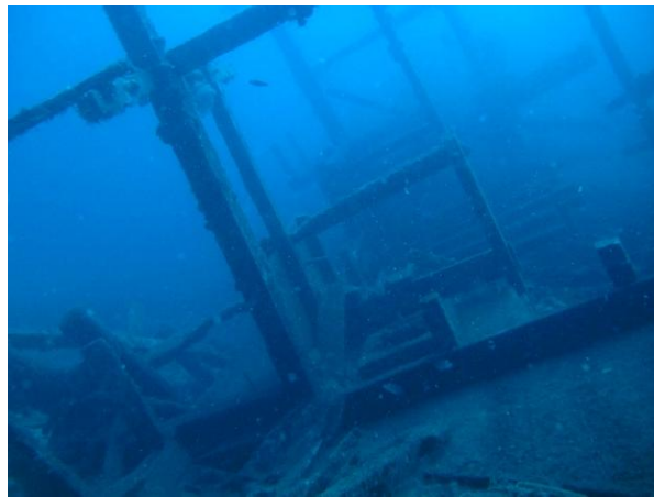
Gambar 1. Kondisi bangkai Kapal Genteng

Situs ini berupa kapal kayu yang tenggelam dalam perjalanan dari Madura ke Kalimantan. Terletak di Perairan Pulau Karimunjawa tepatnya di Perairan Pulau Menjangan pada kedalaman 28-30 m. Untuk mencapai situs ini, diperlukan waktu sekitar 25 menit dari Dermaga Syahbandar dengan menggunakan perahu nelayan/ speedboat . Situs Kapal Genteng ini memiliki muatan berupa bahan pangan, sandang, dan bahan bangunan. Kapal tersebut tenggelam karena ada kerusakan (kebocoran) akibat terkena terjangan gelombang besar. Situs kapal karam ini dikenal oleh masyarakat dengan nama Kapal Genteng karena banyaknya temuan muatan genteng yang berserakan di sekitar kapal tersebut.