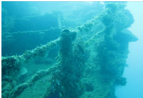
Gambar 2. Kondisi bangkai Kapal Indonoor

Situs Kapal Indonoor ini merupakan situs kapal karam yang paling banyak dikunjungi oleh wisatawan. Selain karena menarik dan menantang, kedalaman situs ini hanya sekitar 15 m sehingga bisa diselami oleh penyelam mulai dari pemula sampai dengan yang sudah ahli. Untuk mencapai situs ini, diperlukan waktu sekitar 70 menit dari Dermaga Syahbandar dengan menggunakan perahu nelayan/ speedboat . Menurut informasi masyarakat lokal, kapal ini tersangkut di terumbu karang dan mengalami kebocoran, dimungkinkan karena gaya berat kapal menyebabkan kapal patah pada beberapa bagian. Tidak ada korban dalam peristiwa ini. Saat ini kapal tersebut hanya tersisa lempengan-lempengan baja hasil penghancuran bom dari beberapa usaha pengangkatan.