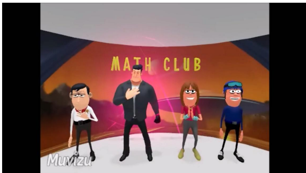
Gambar 1. Hasil tampilan media

Pada proses akhir ini, berdasarkan hasil angket dari para ahli. Pada tahap ini, media yang sudah di uji oleh para ahli untuk selanjutnya akan diteruskan dan diperbaiki sesuai dengan masukan masukan para ahli tersebut. Sehingga tampilan media sebagai berikut: