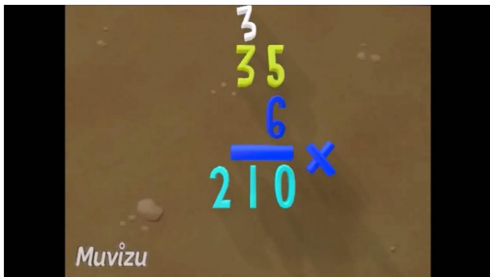
Gambar 4. Hasil tampilan media