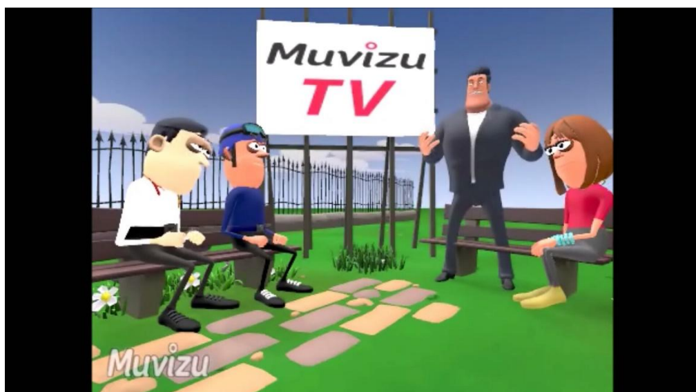
Gambar 2. Hasil tampilan media