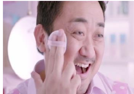
Gambar 6. Iklan produk Etude House Morning Any Cushion Crem Filter - 2016

Secara konotatif, laki-laki paruh baya, berkumis tipis, berkulit gelap dan berjanggut tipis menunjukkan sosok laki-laki maskulin yang ideal, karena tidak terlihat seperti laki-laki yang merawat diri. Karena merawat diri digenderkan terhadap perempuan. Tetapi dengan celemek pink bermotif polkadot sambil memegang bedak, esensi maskulinitasnya menjadi kusut. Kekusutan maskulinitasnya dikarenakan dua hal, yaitu cara memegang bedak yang secara tersirat sebagai ajakan memakai bedak, padahal bedak adalah atribut kecantikan, berarti merupakan ranah feminin. Lalu, celemek biasanya digunakan ketika memasak. Masak merupakan pekerjaan domestik yang selalu dikaitkan dengan perempuan sehingga celemek juga merupakan atribut feminin.