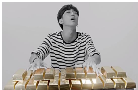
Gambar 9. Iklan produk TonyMoly Gold 24K Mask "gold melody" - 2014

memperhatikan penampilannya bukan lah laki-laki gay , karena dia tertarik pada perempuan. Hal ini menjelaskan bahwa gender tidak berkaitan dengan orientasi seksual seseorang.