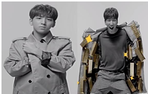
Gambar 11. Iklan produk TonyMoly Gold 24K Mask “gold surprise” - 2014

Secara konotatif, laki-laki atribut hitam dari mulai celana dan hoodie menunjukkan kemaskulinan laki-laki tersebut. Celana olah raga dan Hoodie menunjukkan makna tersirat bahwa laki-laki tersebut berprofesi sebagai atlet. Kemudian, laki-laki ber- hoodie tanpa lengan, dengan sengaja memperlihatkan otot tangannya dengan berpose ala “Ade Ray”. Hal tersebut menunjukkan bahwa laki-laki tersebut memiliki kekuatan, perkasa dan jantan. Selain itu, enam kemasan produk TonyMoly Gold 24K Mask dipinjam untuk mewakili otot perut six pack laki-laki pada iklan tersebut. Six pack pada bagian perut adalah kebanggaan seorang atlet laki-laki. Kemudian produk yang mengganti penggambaran six pack pada laki-laki tersebut, diinterpretasikan bahwa produk enam kemasan produk TonyMoly Gold 24K Mask merupakan kebanggaan laki-laki atlet sama halnya dengan perut six pack . Hal tersebut menunjukkan laki-laki yang maskulin, yang berotot, macho dan kuat tidak perlu malu dan harus bangga dalam menggunakan produk kecantikan.