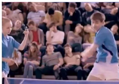
Gambar 2. Iklan produk Etude House BB cream cool skin world championship - 2012

Secara denotatif, gambar 2 menampilkan latar para penonton yang tertidur ketika menyaksikan suatu pertandingan. Terdapat dua pasang pemain, yaitu pasangan berbaju sport berwarna pink melawan pasangan berbaju sport berwarna biru. Pada gambar tersebut terlihat meja tenis dan pemain yang sedang memegang bat tenis meja. Hal tersebut menunjukkan bahwa mereka sedang bermain tenis meja. Dari gambar tersebut, terlihat bahwa pasangan atlet berbaju pink memiliki mata sipit dan berkulit dan pasangan atlet berbaju biru memiliki rambut pirang kecoklatan dan bermata besar. Laki-laki berbaju pink terlihat sedang merapikan rambutnya sambil membuka sedikit mulutnya dan perempuan berbaju pink sedang mengaca sambil duduk di atas papan meja tenis. Sedangkan laki-laki berbaju biru sedang memukul bola dengan ekspresi wajah yang serius dan perempuan berbaju biru sedang mengaca dengan bedak compact -nya (kemasan bedak yang lengkap dengan kaca dan spons bedak) dengan ekspresi khawatir.