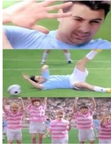
Gambar 1. Iklan produk Etude House BB cream cool skin world championship - 2012

Secara konotasi, tim yang sedang berjaga di depan gawang menunjukkan kesan maskulin dengan mengenakan seragam bola, sekaligus feminin karena mengenakan atribut berwarna pink. Secara normatif warna pink adalah warna perempuan. Sebagaimana menurut Yulius (2015), persepsi warna merah muda sebagai warna feminin dan warna biru sebagai warna maskulin di mulai sejak perang dunia II. Warna pink dianggap secara normatif sebagai warna perempuan, contohnya saja ketika bayi baru lahir biasanya penanda yang diberikan oleh bidan/rumah sakit bersalin berupa gelang plastik. Jika bayi tersebut berjenis kelamin laki-laki maka akan dikenakan gelang plastik berwarna biru, sedangkan bayi berjenis kelamin perempuan akan dipakaikan gelang berwarna pink. Pada akhirnya, menggunakan pakaian atau atribut berwarna pink, ketika digunakan oleh laki-laki berpengaruh pada citranya, yaitu laki-laki feminin.