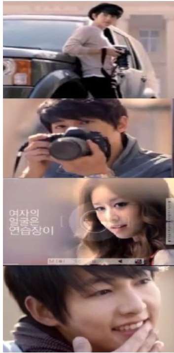
Gambar 8. Iklan produk TonyMoly Floria whitening capsule essence – 2012