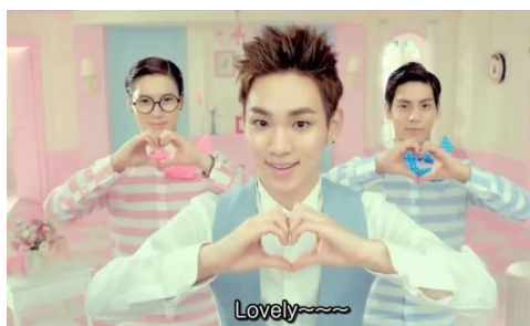
Gambar 4. Iklan produk Etude House eyelash perm 3 step volumecara - 2012

putih dan pink, serta memakai syal pink bermotif polkadot putih. Laki-laki kedua memakai anting berwarna hitam, berkemeja putih dipadukan dengan rompi berwarna biru muda dengan gaya rambut spike berwarna coklat. Laki-laki ketiga memakai kemeja bermotif garis putih-biru, syal biru bermotif polkadot putih dan berrambut hitam mengkilat yang dibelah pinggir dengan sedikit gelombang pada bagian depan rambutnya. Dibelakang mereka terdapat pintu berwarna pink, jam dinding, bingkai foto, lampu, vas bunga serta perabot lain yang di dominasi dengan warna pink, putih dan biru muda.