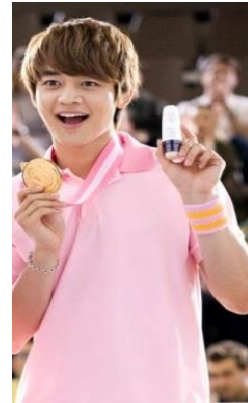
Gambar 3. Iklan produk Etude House BB cream cool skin world championship - 2012

Secara denotatif, pada gambar 3 terdapat laki-laki memakai kaos berkerah berwarna pink, gelang rantai berwarna perak dan handband berwarna pastel. Laki-laki berkalung medali emas ini sedang memegang medali emasnya dan produk Etude House BB cream cool skin . Laki-laki tersebut membuka mulutnya dan giginya terlihat.