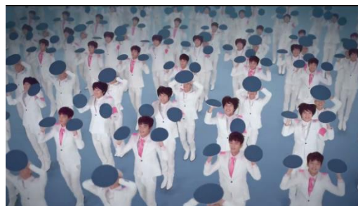
Gambar 5. Iklan produk Etude House bedak precious mineral any cushion - 2013

Secara denotatif, gambar 5 menampilkan kumpulan laki-laki yang sedang berdiri sambil berlompat-lompat. Mereka mengangkat spons bedak dari produk Etude House versi ukuran besar dengan kedua tangan. Beberapa laki-laki memperlihatkan giginya dan beberapa laki-laki terlihat sedang menyunggingkan bibirnya. Kumpulan laki-laki tersebut memakai pakaian yang sama. Mereka mengenakan kostum serba putih, yaitu, celana panjang putih, sepatu putih tuxedo berwarna putih serta mengenakan kemeja pink di dalamnya.