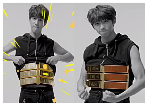
Gambar 10. Iklan produk TonyMoly Gold 24K Mask "gold power" - 2014

seharusnya disentuh oleh laki-laki pada iklan, digantikan oleh produk TonyMoly tadi. Hal tersebut menunjukkan bahwa laki-laki tersebut berprofesi sebagai pemain piano. Menurut Fakih (2006: 8-9), dalam perspektif gender, maskulin adalah sifat yang melekat pada laki-laki yakni kuat, rasional dan perkasa, sedangkan feminin adalah sifat yang melekat pada perempuan yakni, lemah lembut, emosional dan keibuan. Piano yang ditekan dengan kelembutan oleh laki-laki yang peka dan sensitif, menunjukkan bahwa pemain piano merupakan pekerjaan yang bersifat feminin. Makna tersirat dari penggambaran iklan tersebut, yang mana piano merupakan benda yang sangat penting bagi pemusik, dan produk TonyMoly yang dipinjam sebagai elemen pengganti piano juga sama pentingnya dengan piano bagi pemusik. Representasi laki-laki pada gambar 9 mempersuasikan agar laki-laki yang bekerja sebagai pemusik menggunakan kosmetik atau produk kecantikan. Selain itu, teknik pewarnaan grayscale pada iklan menunjukkan kesan yang maskulin, karena warna abu-abu, warna yang merupakan perpaduan antara warna hitam dan putih, merupakan warna maskulin. Menurut Guilfros dan Smith dikutip oleh Khouw (2007), warna akromatik (hitam, putih dan abu-abu) merupakan warna maskulin. Sehingga, tetap menampilkan elemen-elemen maskulin.