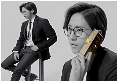
Gambar 12. Iklan produk TonyMoly Gold 24K Mask "gold news" - 2014

Secara denotatif, gambar 12 menampilkan laki-laki berkacamata, bermata tajam dan mulut tertutup. Laki-laki tersebut memiliki rambut yang dibelah pinggir dengan rapi. Laki-laki tersebut memakai pakaian formal, jas hitam, kemeja putih, celana hitam dan berdas. Kemudian dia memegang produk TonyMoly Gold 24K Mask disamping telinganya.