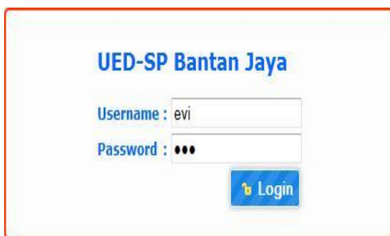
Gambar 2. Tampilan Halaman Login

Hasil dari penelitian ini adalah menghasilkan sebuah sistem informasi rencana angsuran pembayaran pada UED-SP Bantan Tengah menggunakan bahasa pemrograman PHP dan database MySQL . Aplikasi ini hanya memberikan hak akses untuk kasir, sementara ketua dan pendamping desa hanya bisa melihat isi dari aplikasi tanpa bisa mengubah atau menambah data yang ada. Halaman loginsistem ditunjukkan pada Gambar 2.