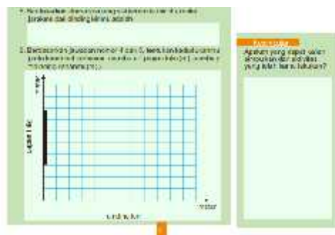
Gambar 2. Contoh Lembar Aktivitas Siswa dalam Modul Ilustratif

mengerjakan aktivitas siswa dalam modul yang dilakukan secara kelompok akan tetapi dalam pelaporannya dilaporkan secara mandiri dan siswa diharuskan untuk menuliskan kesimpulan sendiri juga merupakan bentuk melatih kemandirian siswa dalam belajar. Lembar aktivitas siswa dalam modul ilustratif seperti pada gambar 2.