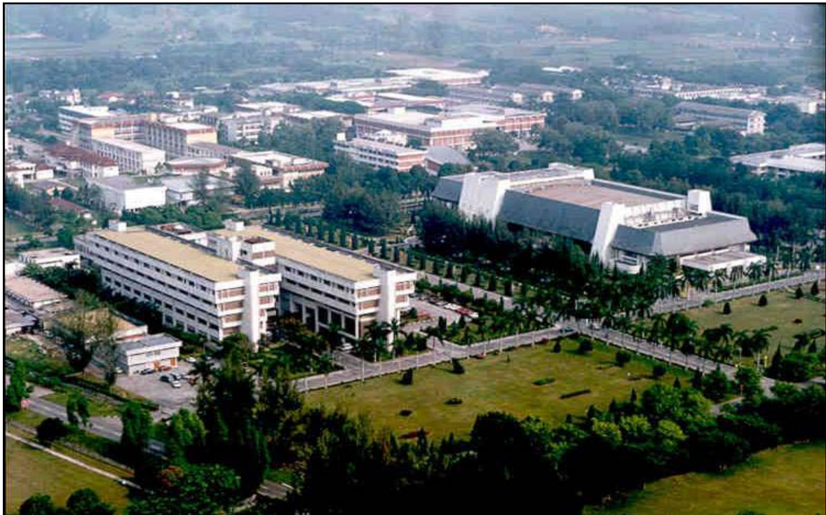
IPT (Institusi Pengajian Tinggi) di Malaysia

Pelaburan dalam pendidikan tinggi dan pembangunan modal insan di Malaysia sangat kritikal dalam menzahirkan masyarakat yang memiliki akal budi luhur, berfikiran terbuka, berpandangan jauh, dan mempunyai daya employability (pasaran kerja) yang tinggi. Justeru, modal insan menjadi peneraju utama dalam membentuk sebuah negara yang maju serta seimbang dalam pembangunan ekonomi dan sosialnya, memiliki warga yang bersatu-padu, berbudaya, berpekerti mulia, berkemahiran, berfikiran maju, dan berpandangan komprehensif.