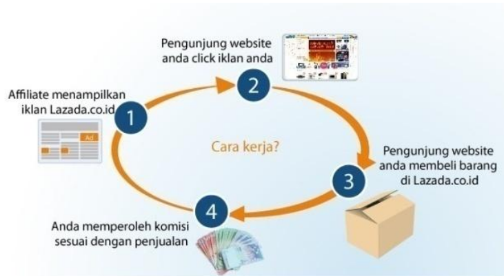
Gambar 3 Tampilan proses inialisai lazada.co.id

Proses ini merupakan tahap inialisasi untuk memperjelas ruang lingkup sistem yang di dimanfaatkan untuk membuat dokumentasi. Sehingga perlu adanya data data berupa deskripsi produk, rencana strategis, pemilihan kriteria proyek, jejak rekam informasi. Lazada.co.id sebagai bisnis IT online yang mempunyai fitur unggulan untuk menelaah tahap inialisasi yang dinamakan affiliate program . Dalam bahasa indonesia di sebut dengan program afiliasi atau kemitraan, program ini merupakan suatu teknik maketing, penjual bekerjasama dengan pemasar melalui website pemasar ( e-commerce ). Dalam prakteknya para pemasar mendapatkan link khusus yang sudah diberi tracking (pelacak) sehingga setiap transaksi yang datang dari pemasar akan diketahui oleh sistem afiliasi penjual. Jika penjualan memenuhi kriteria afiliasi maka pemasar akan mendapatkan komisi dari penjualan tersebut. Komisi penjualan biasanya berupa persentasi dari harga barang yang telah terjual. Dalam kasus program afiliasi Lazada.co.id, komisi yang Lazada.co.id berikan sebesar 2,5-10% tergantung dari kategori produk di dalam transaksi yang berasal dari pemasar yang bersangkutan. Berikut ini penjelasan proses kerja program affiliate lazada.co.id berupa tampilan: