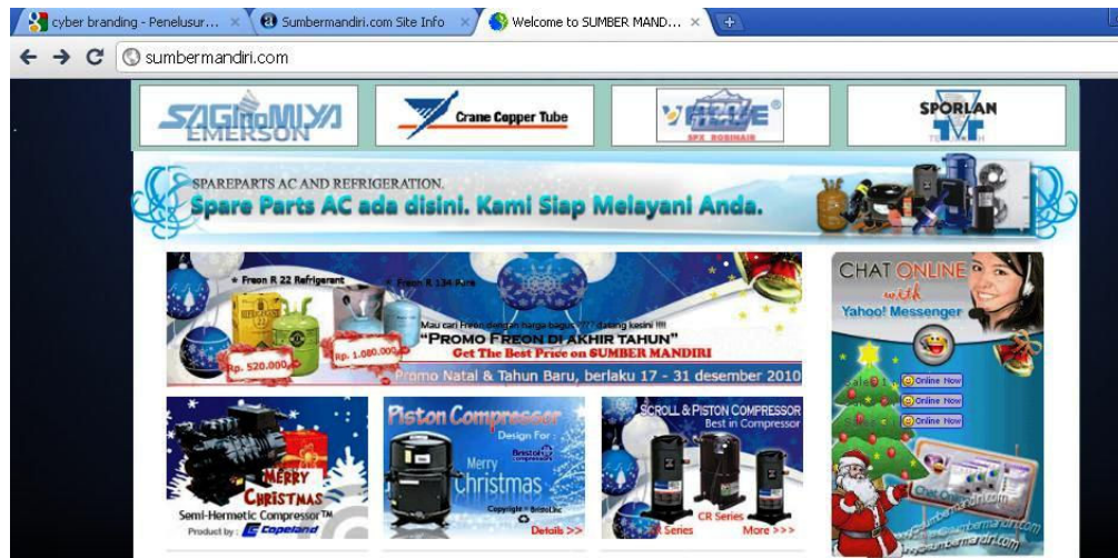
Gambar 3. Website milik PT. Sumber Mandiri

diakses, situs ini menduduki peringkat pertama di search engine google.com untuk search query "spare parts ac" dan urutan kedua untuk search query "spare part ac"