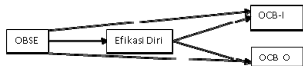
Gambar 1 Kerangka Konseptual Hubungan OBSE, Efikasi Diri, dan OCB

hubungan ketiga variable tersebut, maka dapat digambarkan kerangka hubungan ketiganya dalam gambar 1. sebagai berikut: