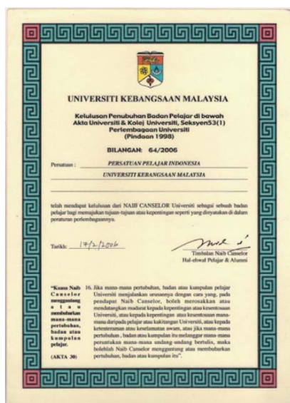
Gambar 3. Akta Kelulusan PPI – UKM tahun 2006

Pergerakan organisasi pelajar ditingkat perguruan tinggi merujuk kepada peraturan atau Akta Pertubuhan Mahasiswa Syeksen 53(1) Perlembagaan Universiti Pindaan (1998) di setiap universiti. Kelulusan akta ini dikeluarkan oleh Naib Canselor disetiap perguruan tinggi Tujuan dari peraturan/akta ini untuk mengatur segala keperluan mahasiswa serta menjalankan fungsi akademik dan non-akademik serta manfaat dan kemajuan universiti. Pada gambar 3 merupakan akta Pertubuhan Pelajar yang dikeluarkan oleh Universiti Kebangsaan Malaysia, Selangor pada tahun 17 bulan Februari 2006.