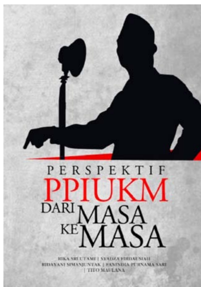
Gambar 8. Buku hasil pemikiran – pemikiran pelajar PPI – UKM dalam menjalankan organisasi

Website yang ditampilkan pada gambar 7 memberikan maklumat tentang keadaan dilingkungan UKM serta PPI – UKM secara institusi dan keadaan mahasiswa sebagai penggerak organisasi didalamnya. Semua aktifitas organisasi akan tercatat secara jumlah disetiap bulan serta memberikan pemberitahuan kepada seluruh anggota tentang kegiatan terbaru didalam organisasi. Bentuk maklumat diberikan kedalam bentuk atau format blog. Produk ini menunjukkan kualitas kegiatan serta memberikan manfaat bagi setiap anggota PPI – UKM.