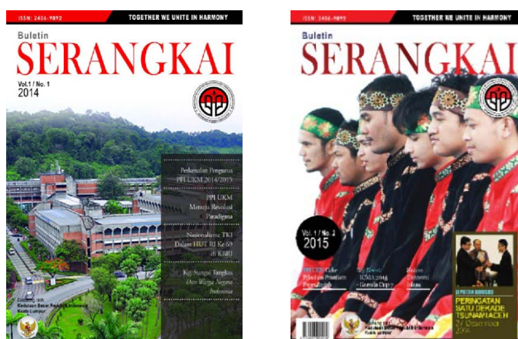
Gambar 9. Buletin Serangkai Volume.1 No.1 dan Volume 1 No.2.

Untuk memberikan informasi mengenai kegiatan Pelajar PPI – UKM secara internal dan eksternal dan keadaan masyarakat – masyarakat yang berinteraksi dengan pihak PPI, pengurus membangun sebuah media buletin yang disebut sebagai Buletin Serangkai. Pelajar PPI – UKM mendapatkan pelajaran secara langsung mengetahui tentang proses penerbitan dari menulis artikel populer sampai dengan pengaturan dan tata letak majalah yang baik dan menarik untuk masyarakat pembaca.