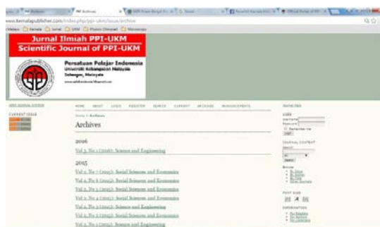
Gambar 6. Bentuk jurnal online yang dikelola oleh PPI – UKM

Sesuai dengan rencana dan program yang dijalankan oleh pengurus, PPI – UKM harus memberikan hasil kerja atau produk yang dapat memberikan manfaat bagi anggota PPI – UKM maupun masyarakat lainnya. Produk hasil kerja bukan dihitung tingkat besarnya kegiatan ataupun mahalnnya biaya untuk menjalankannya. Keberlanjutan produk secara berkala sangat diperlukan didalam hasil kerja ini.