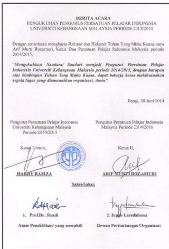
Gambar 4. Berita Acara Pengukuhan PPI – UKM

Begitupula dengan gambar 5 (a), (b), (c) dan (d) merupakan Surat Keputusan yang dibuat oleh Pengurus PPI – UKM mengenai susunan pengurus PPI – UKM periode 2014 – 2015. Surat ini didasarkan kepada Akta Kelulusan yang dikeluarkan oleh Universitas Kebangsaan Malaysia sebagai kekuatan hukum yang berada dilingkungan Universitas untuk menjalankan organisasi pelajar disertai AD, ART serta agenda rapat yang diselenggarakan oleh Ketua Umum terpilih pada masa bakti tersebut.