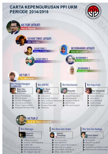
Gambar 2. Carta Organisasi PPI – UKM [1].

Pada gambar 2 dibawah ini terlihat carta organisasi yang berbasis internal dan eksternal sesuai dengan kepentingan organisasi PPI – UKM. Terlihat dari struktur organisasi bahwa manajemen organisasi dapat diatur oleh Sekretaris Jenderal yang akan mengatur segala bentuk adminstratif semua kegiatan yang akan dijalankan setiap bidang – bidang terkait. Sekretaris Umum akan memberikan segala keperluan yang berkait dengan landasan organisasi atau aspek hukum organisasi PPI – UKM.