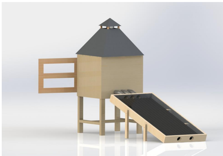
Gambar 1. Alat Pengering Indirect Pasive Solar drayer

Alat pengering yang dirancang harus memenuhi persyaratan sebagai alat pengering bahan pangan agar tidak merusak nutrisi yang terkandung didalamnya. Suhu alat pengering harus kurang dari 80^{\circ}\text{C} agar nutrisi tidak rusak. Namun demikian pemanasan harus berjalan efektif dan efisien. Dalam teknologi pasive solar dryer, terdapat dua faktor yang mempengaruhi