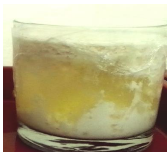
Gambar. 3 Proses Pembentukan dadih (bagian atas) dan whey (bagian bawah)

yang disebut dengan whey , dapat dilihat pada Gambar 3.