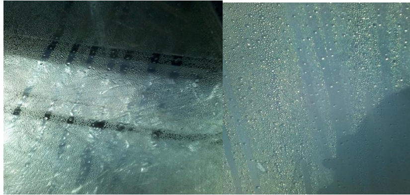
Gambar 4. Bulir-Bulir Air Hasil Evaporasi

Air yang menguap tersebut tidak lagi mengandung garam (tawar) dan dapat langsung diminum. Jika volume air baku dalam wadah berkurang, maka akan ditambahkan kembali sesuai dengan kapasitas daya tampung wadah lantainya. Setelah beberapa hari, air yang masih tersimpan dalam wadah akan mengandung konsentrasi garam yang sangat tinggi sehingga proses evaporasi dapat diteruskan hingga selesai (air dalam wadah mengering). Saat air dalam wadah mengering maka akan tampak kristal-kristal garam yang jumlahnya sesuai dengan kandungan dalam air laut.