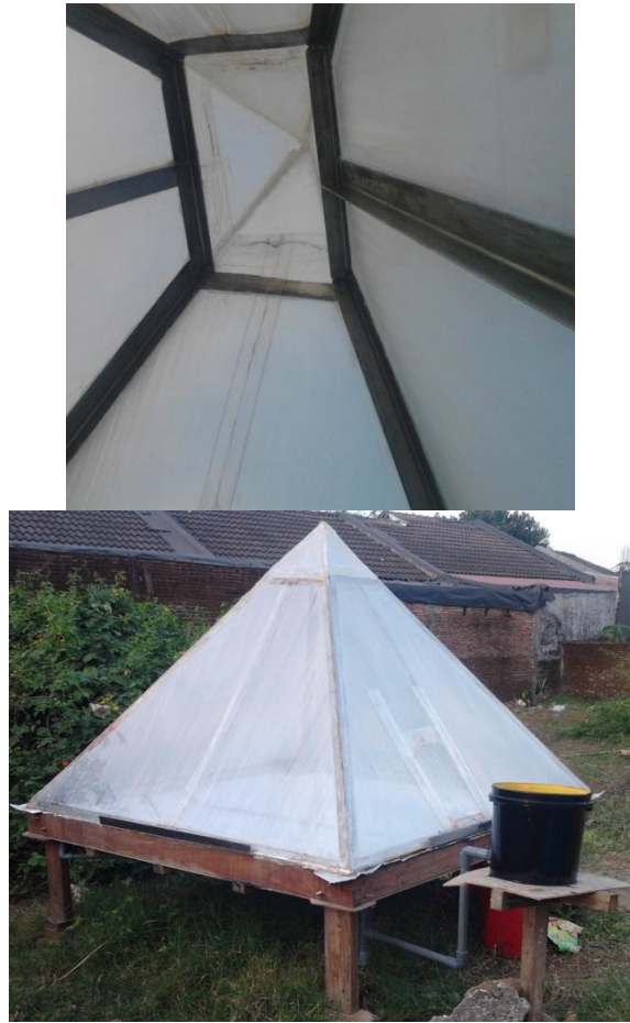
Gambar 3. Dinding Piramida (Fiberglass) Tampak dari Dalam dan dari Luar