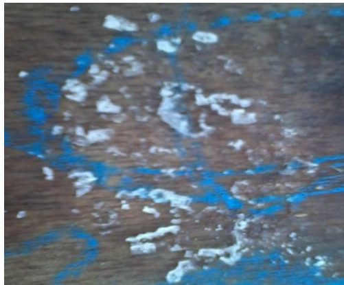
Gambar 5. Kristal-Kristal Garam (Putih) yang Terbentuk dari Akhir Evaporasi

Air yang menguap tersebut tidak lagi mengandung garam (tawar) dan dapat langsung diminum. Jika volume air baku dalam wadah berkurang, maka akan ditambahkan kembali sesuai dengan kapasitas daya tampung wadah lantainya. Setelah beberapa hari, air yang masih tersimpan dalam wadah akan mengandung konsentrasi garam yang sangat tinggi sehingga proses evaporasi dapat diteruskan hingga selesai (air dalam wadah mengering). Saat air dalam wadah mengering maka akan tampak kristal-kristal garam yang jumlahnya sesuai dengan kandungan dalam air laut.