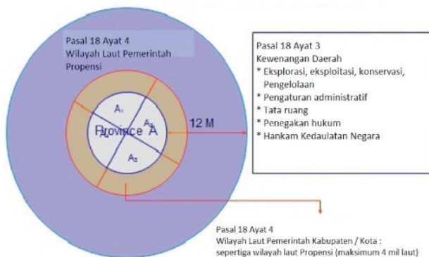
Gambar 1. Ilustrasi Pasal 18 (4) UU 32/2004