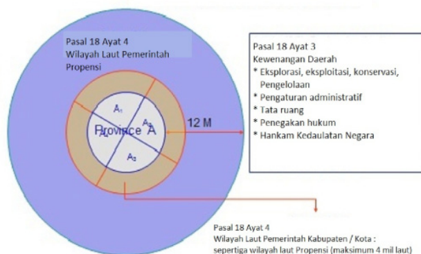
Gambar 1. Ilustrasi Pasal 18 (4) UU 32/2004