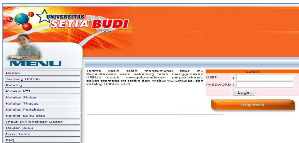
Gambar 1 Tampilan Halaman USBLib

terkait, yang diperlukan dalam perancangan sistem tampilan file PDF online. Dimana data yang software. Dimana rancangan desain yang di bangun berupa tampilan file PDF berbasis online