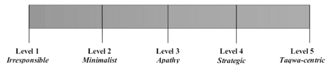
Gambar 2. Islam Position in CSR Continuum

Dari konsep ini juga, muncul posisi Islam dalam konsep CSR sehingga akan muncul beberapa rangkaian dimulai dari sikap tidak bertanggung jawab perusahaan hingga sikap tanggung jawab perusahaan dalam melaksanakan CSR berdasarkan God-consciousness (takwa sentris). 26