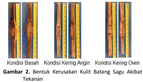
Gambar 2. Bentuk Kerusakan Kulit Batang Sagu Akibat Tekanan

Hasil uji kuat tekan pada tabel 2 dan gambar 1 menunjukkan bahwa kulit tekan kulit batang sagu lebih tinggi pada kondisi basah dibandingkan pada kondisi kering. Hasil tersebut berbeda dengan hasil yang diperoleh Nuryawan dkk. yang menyebutkan bahwa kekuatan papan akan berkurang sekitar 15-25% apabila terjadi peningkatan kadar air 10% [11]. Hal ini disebabkan karena kulit batang sagu tersusun atas serat-serat kayu yang kasar. Ikatan antar serat tersebut menjadi lebih kuat pada saat basah.