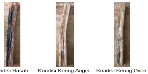
Gambar 4. Kondisi Kulit Batang Sagu setelah Uji MOR

Mekanisme fiber pull out pada serat yang panjang dan tersusun teratur. Pada saat matriks mengalami kegagalan, serat masih dapat menanggung beban, beban akan terdistribusi sampai ke serat dan menyebabkan serat tertarik keluar, sehingga proses terjadinya patahan tidak berlangsung secara bersamaan. Hal ini berbeda pada serat yang pendek dan acak, ikatan antarmuka serat dengan matriks tidak mampu menahan laju kenaikan tegangan permukaan, sehingga pada saat matriks mengalami kegagalan, serat tidak mampu menahan beban, sehingga patahan terjadi bersamaan dengan kegagalan matriks [21].