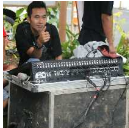
Gambar 2. Siaran off-air tradisi ngaruat lembur

kegiatan budaya ngaruat lembur atau off-air . Kejelasan suara dan gaya penyampaian dari penyiar sangat menentukan tersampainya informasi pada pendengar. Informasi tersebut harus sampai pada pendengar yang berada di wilayah pelosok Desa Cisewu. Hal ini ditunjang perlengkapan siaran Radio RASI FM. Walaupun perlengkapan siarannya masih sederhana, namun isi pesan dapat tersampaikan pada pendengar. Begitupun dalam membuat dokumentasi audio-visual oleh penyiar. Mereka menggunakan handycam sebagai alat membuat video.