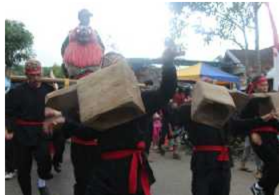
Gambar 1. Atraksi gègèl jubleug

berpartisipasi maka diadakan pertunjukan khas dan permainan tradisional di masyarakat. Di Desa Cisewu pun seperti itu. Salah satunya ialah pertunjukkan gègèl jubleug . Beberapa orang yang telah memiliki keahlian atau kemampuan dalam pertunjukkan ini, menggigit jubleug , yakni alat menumbuk padi, melalui giginya langsung tanpa alat bantu. Dari hal ini, memperlihatkan bahwa jubleug erat kaitannya dengan padi, bahwa padi dapat dimanfaatkan manusia jika telah mengalami proses penumbukkan dalam jubleug . Padi menjadi pangan pokok masyarakat Sunda, di mana dalam cara mengolahnya pun harus memanfaatkan media yang berasal dari alam. Jubleug , diambil dari pohon nangka yang lalu diukir menyerupai wadah besar untuk menumbuk padi.