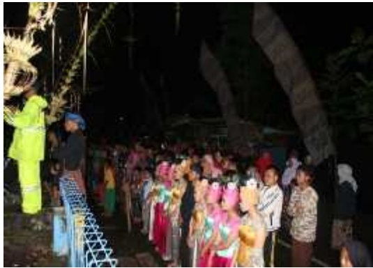
Gambar 4. Berdoa dalam ngaruat lembur

rus menghormati bumi dan langit. Tradisi ngaruat lembur , mengajarkan masyarakat Desa Cisewu untuk bersyukur, sebagai langkah awal menjaga langit dan bumi. Masyarakat Sunda berkomunikasi dengan Tuhan Yang Maha Esa, dirinya sendiri, dengan orang lain, waktu, dan hubungan dengan alam.