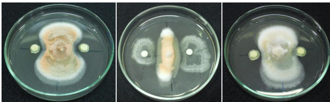
Gambar 2 Daya hambat bakteri endofit; (A) ER10I, (B) EF14III, (C) ER1I, terhadap Fusarium sp. pada hari ke 7 setelah inokulasi pada media PDA.

Berdasarkan pada karakter morfologi, fisiologi, dan biokimianya yang dilakukan di....., maka isolat EF14III, ER1I dan ER10I diidentifikasi berturut-turut sebagai Lactobacillus sp., Pseudomonas sp., dan Acromonas sp. (Tabel 3).