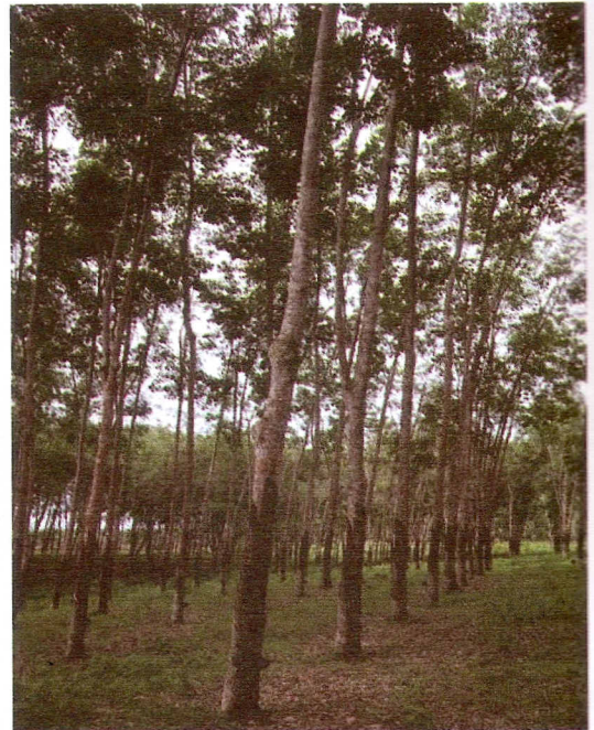
Gambar 5. Penampilan klon IRR 119 di KP.Sungei Putih.