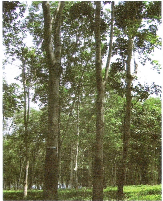
Gambar 3. Penampilan klon IRR 112 di KP.Sungei Putih.