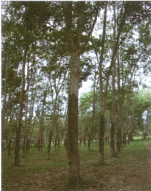
Gambar 2. Penampilan klon IRR 107 di KP.Sungei Putih