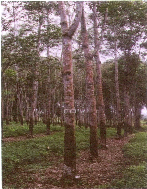
Gambar 4. Penampilan klon IRR 118 di KP.Sungei Putih.