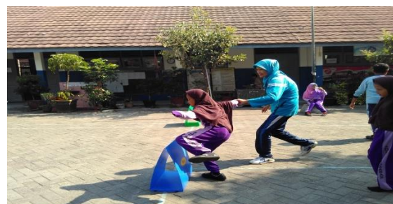
Gambar 2. Kegiatan Pembelajaran Penjas Adaptif

Sementara hasil observasi pada pembelajaran penjas ditemukan data sebagai berikut: