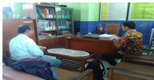
Gambar 1. Wawancara terhadap kepala sekolah dan guru kelas

pendamping dalam proses pembelajaran di kelas.