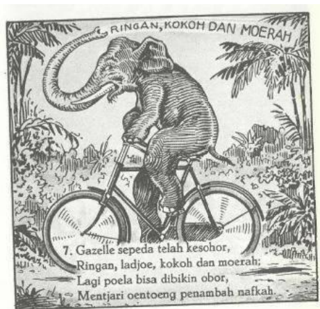
Gambar 5 Iklan Sepeda Gazelle

poela bisa dibikin obor. Mentjari oentoeng penambah nafkah. Penggunaan huruf oe pada moerah /murah/, ladjoe /laju/, poela /pula/, dan oentoeng /untung/. Penggunaan huruf tj untuk huruf c pada mentjari /mencari/.