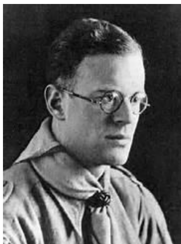
Gambar 1 Charles Adriaan van Ophuijsen

diakritik meliputi tanda koma (,), ain ('), dan trema ("). Ejaan van Ophuijsen berlaku dari tahun 1901 sampai dengan tahun 1947.