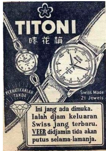
Gambar 9 Arloji Titoni

Ejaan yang digunakan di dalam iklan arloji Titoni adalah Ejaan Soewandi. Di dalam teks iklan tersebut terdapat teks yang berbunyi Titoni. Swiss Made 21 Jewels. Ini jang ada dimuka. Ialah djam keluaran Swiss jang terbaru. Veer didjamin tida akan putus selama-lamanja. Penggunaan huruf j dibaca /y/ pada jang dan selama-lamanja . Penggunaan huruf dj dibaca /j/ pada djam dan didjamin . Penggunaan kata di sebagai kata depan dan di sebagai imbuhan belum jelas, seperti pada frasa dimuka seharusnya ditulis di muka .