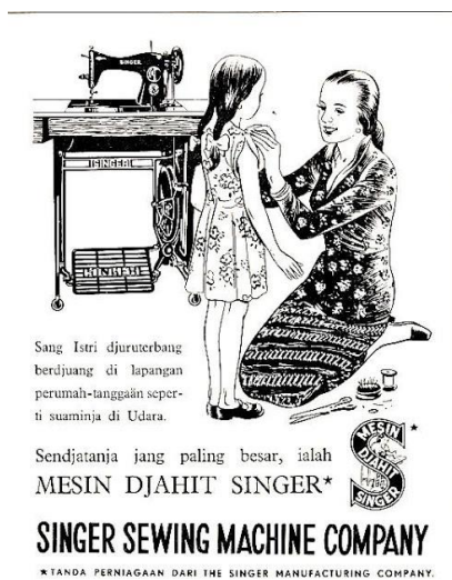
Gambar 7 Iklan Mesin Djahit Singer

Udara. Sendjatanja jang paling besar, ialah MESIN DJAHIT SINGER. Penggunaan huruf dj dibaca /j/ pada djuruterbang, berdjuang, sendjatanja, dan djahit. Penggunaan huruf j dibaca /y/ pada suaminja dan sendjatanja.