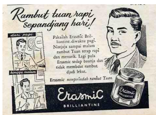
Gambar 8 Krim Rambut Erasmic Brilliantine

Ejaan yang digunakan di dalam iklan krim rambut Erasmic Brilliantine adalah Ejaan Soewandi. Di dalam iklan tersebut terdapat teks yang berbunyi Rambut tuan rapi sepanjang hari! Pakailah Erasmic Brilliante diwaktu pagi. Nistjaja sampai malam rambut Tuan tetap rapi dan menarik. Lagi pula Erasmic sedap baunja dan tidak membuat rambut djadi lekat. Erasmic memperindah rambut Tuan. Penggunaan huruf dj dibaca /j/ pada sepanjang dan djadi . Penggunaan huruf tj dibaca /c/ pada nistjaja . Penggunaan huruf j dibaca /y/ pada nistjaja dan baunja . Penggunaan di sebagai kata depan belum dipisahkan dengan di sebagai imbuhan, seperti pada diwaktu .