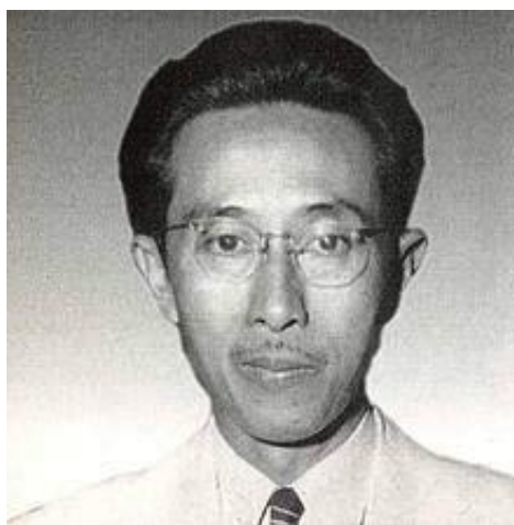
Gambar 2 Mr. Soewandi

Berikutnya, Ejaan Soewandi atau Ejaan Republik. Ejaan ini muncul karena dilatarbelakangi adanya keinginan para cendekiawan dan budayawan Indonesia yang hadir dalam Kongres Bahasa Indonesia I di Solo, 25—28 Juni 1938, untuk melepaskan pengaruh kolonial Belanda terhadap bahasa Indonesia. Saat itu, Mr. Soewandi selaku Menteri Pengajaran, Pendidikan, dan Kebudayaan, melalui surat keputusannya No. 264/Bhg. A, 19 Maret 1947, memutuskan untuk mengganti Ejaan van Ophuijsen. Ejaan pengganti itu disebut "Ejaan Soewandi" atau "Ejaan Republik". Disebut "Ejaan Republik" karena ejaan tersebut lahir setelah kemerdekaan Republik Indonesia, 17 Agustus 1945. Ada empat ciri penanda lingual dalam Ejaan Soewandi, yaitu (1) penggantian huruf oe menjadi u , (2) bunyi sentak ditulis dengan k , (3) kata ulang boleh ditulis dengan angka 2 , dan (4) tidak dibedakan antara penulisan di sebagai awalan dan di sebagai kata depan.