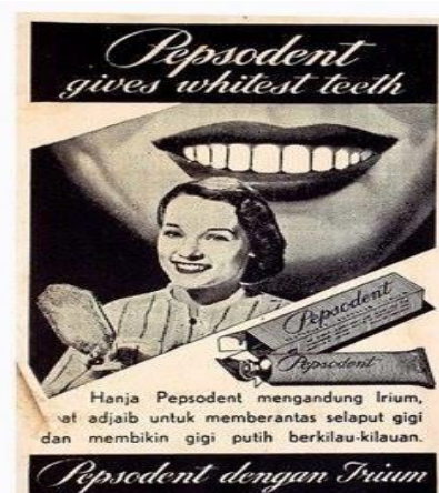
Gambar 10 Iklan Pepsodent

Ejaan yang digunakan di dalam iklan pasta gigi Pepsodent adalah Ejaan Soewandi. Di dalam iklan tersebut terdapat teks yang berbunyi Pepsodent gives whitest teeth. Hanja Pepsodent mengandung Irium, zat adjaib untuk memberantas selaput gigi dan membikin gigi putih berkilau-kilauan. Pepsodent dengan Irium. Penggunaan huruf j dibaca /y/ pada hanja . Penggunaan kata dj dibaca /j/ pada adjaib .