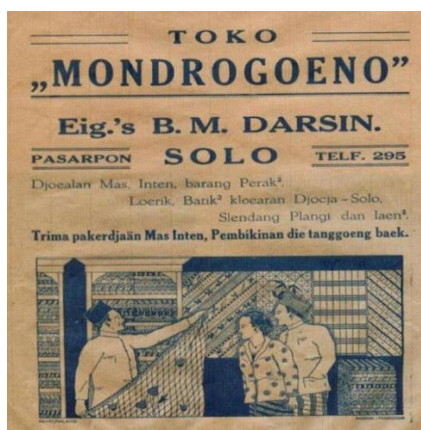
Gambar 4 Iklan Toko Mondrogoeno

Ejaan yang digunakan di dalam iklan Toko Mondrogoeno adalah Ejaan van Ophuijsen. Di dalam iklan tersebut terdapat teks yang berbunyi Toko Mondrogoeno. Eig's B. M. DARSIN. Pasarpon. Solo. Telf. 295. Djoelan Mas, Inten, barang Perak 2 , Loerik, Batik 2 kloearan Djocja-Solo, Slendang Plangi dan laer 2 . Trima pakerdjaän Mas Inten, Pembikinan die tanggoeng baek. Penggunaan huruf oe pada Mondrogoeno /Mondroguno/, Djoelan /Jualan/, dan tanggoeng /tanggung/. Kemudian penggunaan tanda diakritik berupa ain (') pada kata Eig's . Selanjutnya, kata ulang ditulis dengan angka 2 pada Perak 2 , Batik 2 , dan laer 2 .