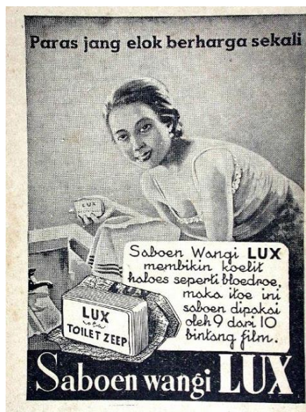
Gambar 3 Iklan Saboen Wangi LUX