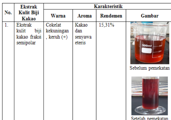
Tabel 1. Karakteristik Ekstrak Kulit Biji Kakao

Selanjutnya ekstrak kulit biji kakao tersebut diaplikasikan pada produk baso UKM Baso Cipluk (Gambar 2.). Hasil menunjukkan bahwa warna relatif sama, aroma sedikit asam, dan terdapat sedikit aftertaste sehingga masih perlu dilakukan optimalisasi terhadap karakterisasi baso tersebut.